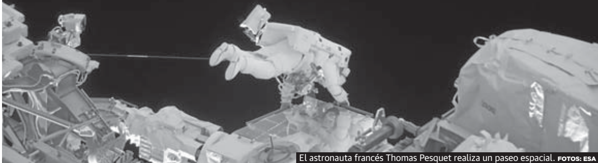
El astronauta francés Thomas Pesquet realiza un paseo espacial.

La ESA presenta sus planes para 2021 con la vista puesta en la Luna y Marte, y con la idea de mirar cara a cara a la NASA