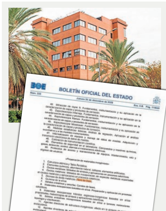
Fachada del Instituto de Tecnología Química del CSIC (Valencia), arriba, y la página del BOE, donde aparece la polémica anotación