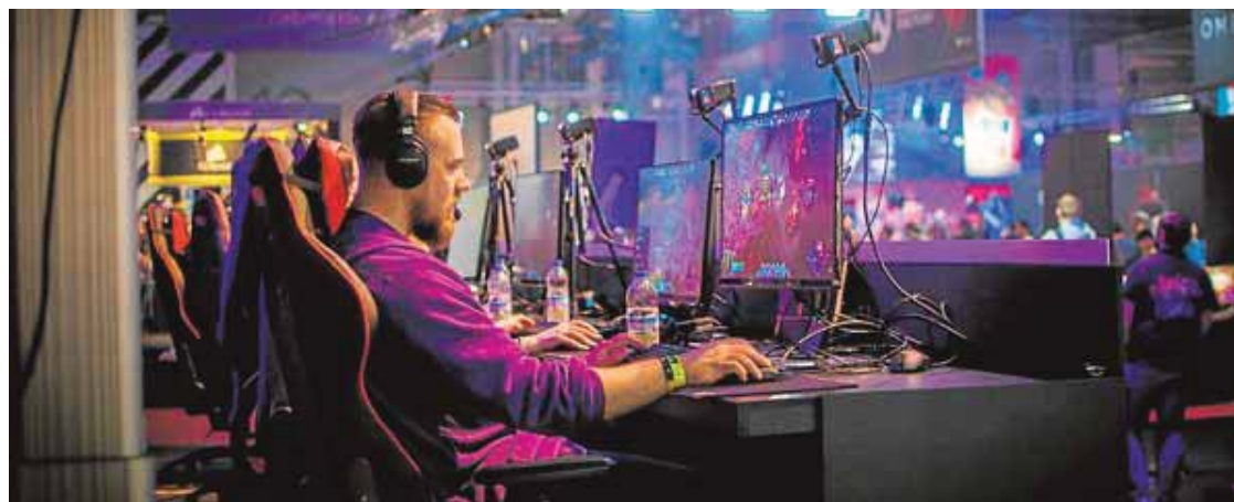
Los deportes electrónicos tienen cada vez más auge y relevancia en la sociedad. UMU

«Se trata de un ámbito que tiene cada vez más auge y relevancia en nuestra sociedad. Actualmente la mayoría de equipos deportivos de élite cuentan con un equipo en ligas 'e-sport'. Esta industria mueve ya la misma cantidad de dinero que el tenis profesional y el número de espectadores que tienen sus finales es igual o mayor que el de las grandes competiciones deportivas», explica Valero. La Facultad de Ciencias del Deporte de la Universidad de Murcia se interesa por este tipo de actividad que entra en confrontación con el deporte tradicional, pero que tal como responden los investigadores, podría ser una aliada en el siglo XXI si se le aporta el enfoque adecuado.