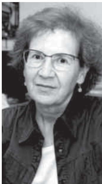
Margarita del Val.

En el último año, debido a la pandemia, Del Val se ha posicionado como una de las científicas de referencia en España para