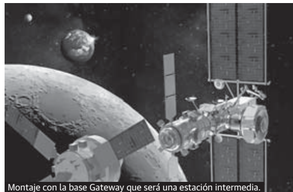
Montaje con la base Gateway que será una estación intermedia.

Sin embargo, esta no será la única incursión espacial de un astronauta europeo en 2021. La ESA ha anunciado que este nuevo año tiene programados más