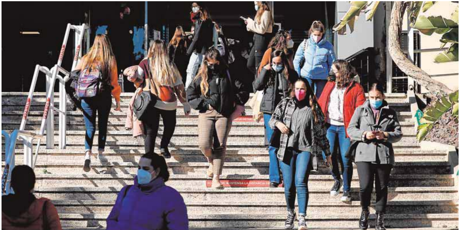
Estudiantes de la Universidad de Murcia, en las escaleras de acceso al Aulario Giner de los Ríos, en Espinardo.