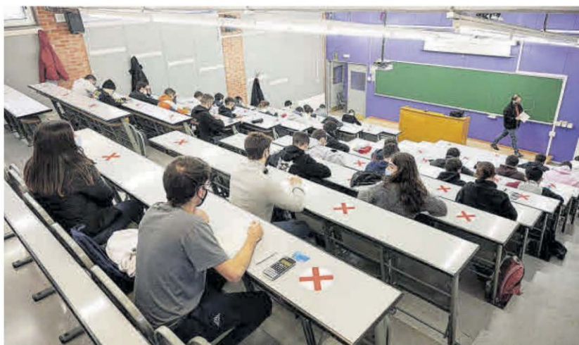
Vista general de un examen de la Universitat Politècnica de Catalunya, durante un examen, ayer.

Tanto la Universitat Politècnica de Catalunya (UPC) como la Universitat Autònoma de Barcelona (UAB) continuarán llevando a cabo los exámenes de manera presencial en la medida de lo posible y de acuerdo con las instrucciones que reciban del Provicat. En ambos casos, cada facultad y cada centro decide cómo se efectúa la evaluación. Los exámenes presenciales también se realizan según lo haya considerado y previsto cada profesor. En el caso de la UAB, en los próximos días se va a reunir el consejo de Gobierno a petición de los estudiantes para garantizar que no se produzcan desajustes entre la evaluación presencial y la evaluación online y