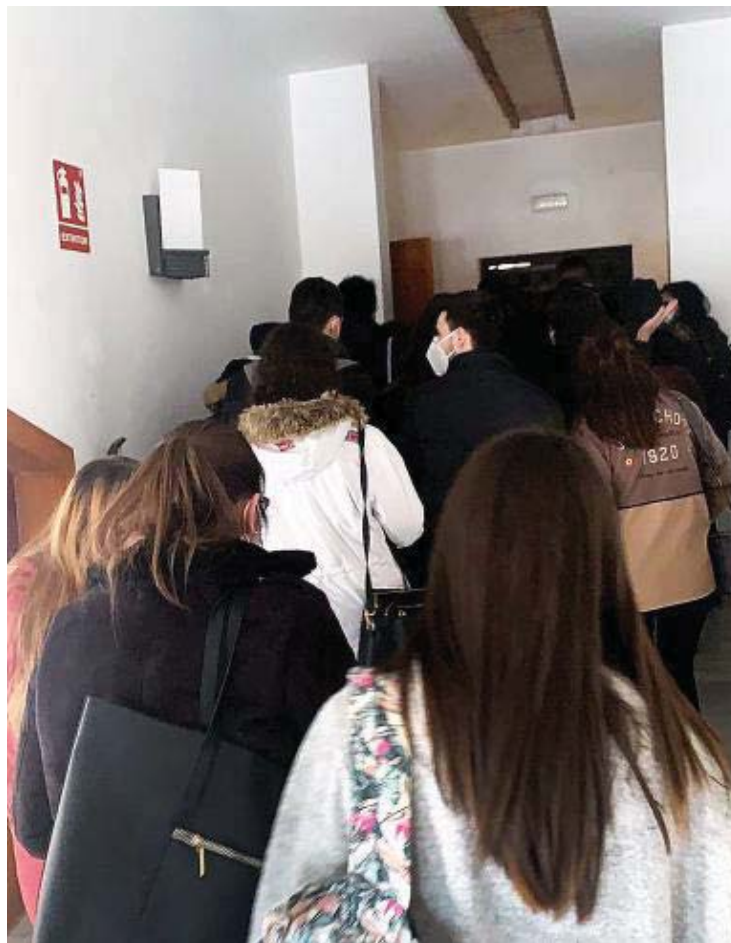
La asociación UEP denuncia aglomeraciones a la entrada de las aulas.

Con todo ello, la responsable académica considera que «no existe ningún argumento legal» para cambiar las evaluaciones a la modalidad online porque no han llegado directrices al respecto por parte ni de la Junta ni del Gobierno central, al tiempo que insiste en que la opción actual no la ha tomado de forma exclusiva la UBU, sino «las cuatro universidades públicas de la región y la CRUE». Si la situa-