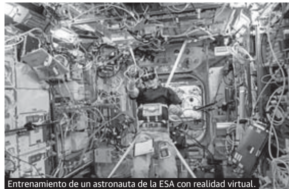
Entrenamiento de un astronauta de la ESA con realidad virtual.

viajes con destino Gateway. A partir de febrero se abrirá el proceso de selección para escoger los tres viajeros que llegarán a esa futura base espacial. Un paso intermedio que será la nueva estación que hará de intercambiador para conseguir poner el pie en el planeta rojo. «Situada más lejos de la Tierra que la actual estación espacial, la Gateway ofrecerá un puesto de apoyo para las misiones a la Luna y Marte», asegura la ESA.