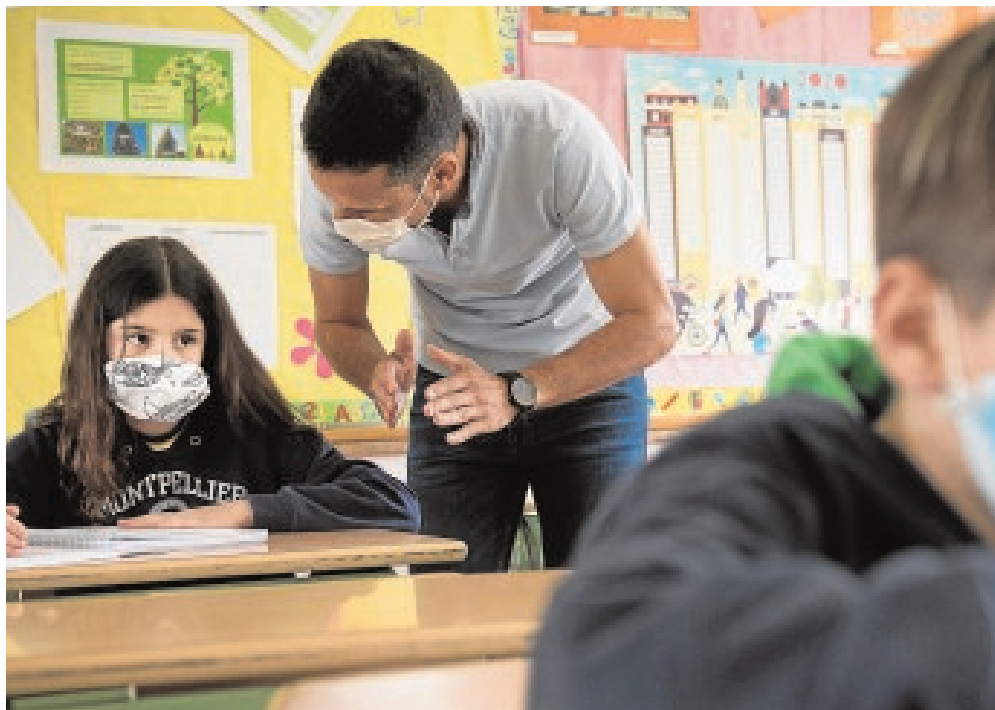
Un docente imparte una clase, en una imagen de archivo

Asimismo, la Comunidad va a incorporar a través de la Oferta de Empleo Público 42 plazas del Cuerpo de