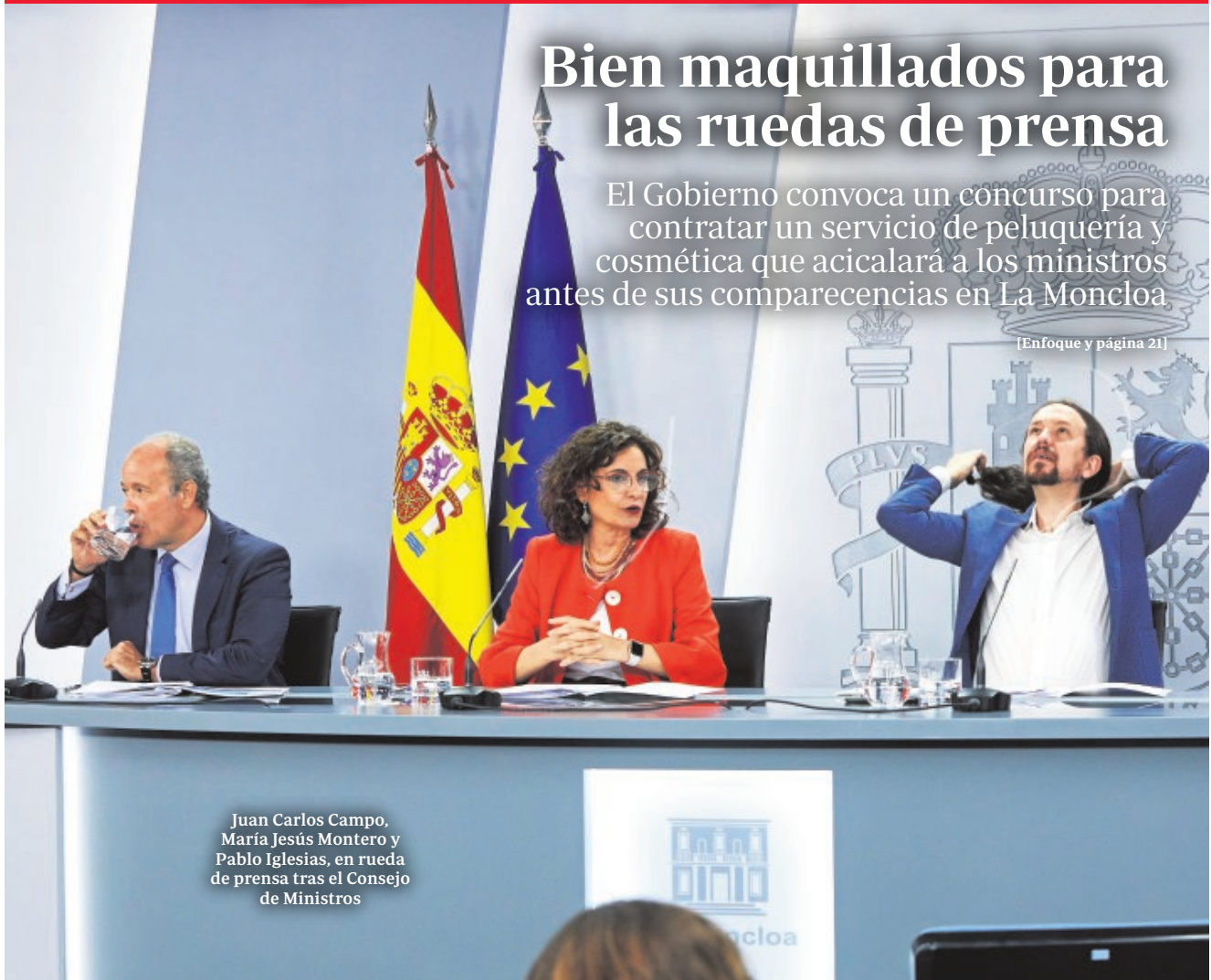
Juan Carlos Campo, María Jesús Montero y Pablo Iglesias, en rueda de prensa tras el Consejo de Ministros