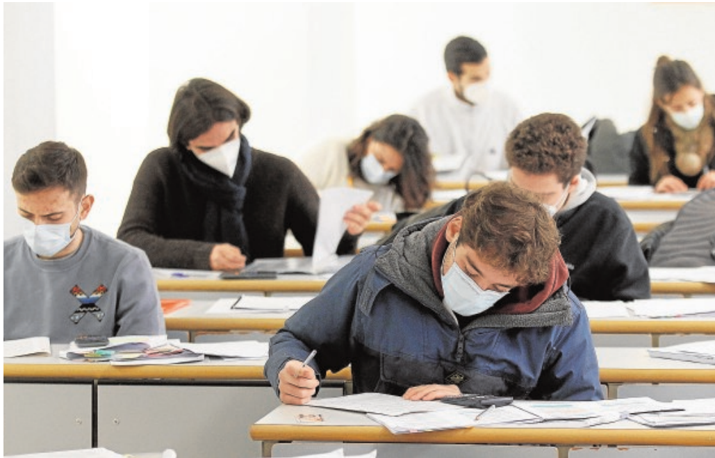
Universitarios haciendo exámenes esta semana en la Pablo de Olavide