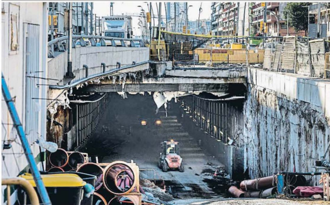
LAS GLÒRIES YA LE VE EL FINAL AL TÚNEL