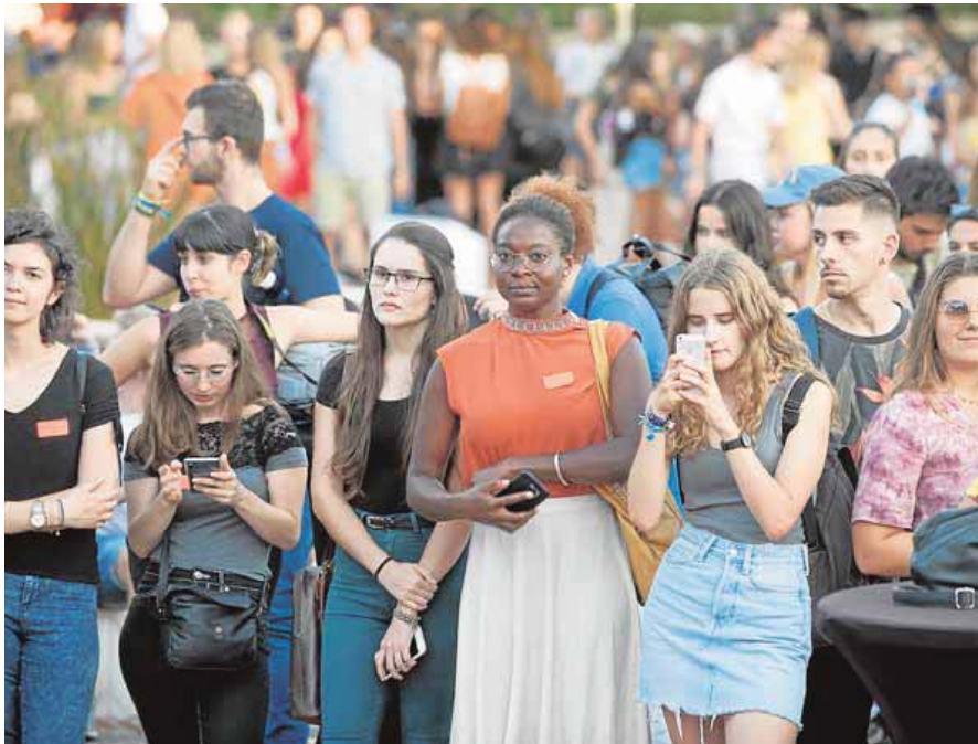
Alumnos erasmus internacionales, en el tradicional acto de bienvenida a la UMA. FRANCIS SILVA

El próximo curso académico 2021/22 (hasta el 31 de mayo de 2022) será el último en el que un total de 80 universitarios malagueños ya inscritos podrán realizar sus estancias en el Reino Unido. Su financiación procede del plazo de 24 meses que la Comisión Europea ha concedido a la Universidad de Málaga para ejecutar el dinero concedido en el año 2020, con cargo al programa