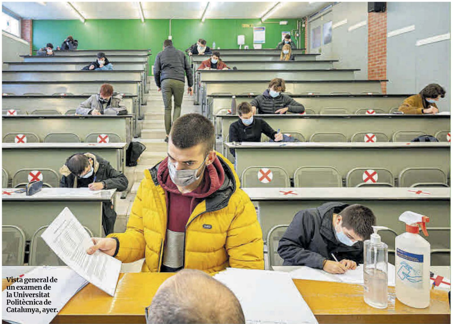
Vista general de un examen de la Universitat Politècnica de Catalunya, ayer.