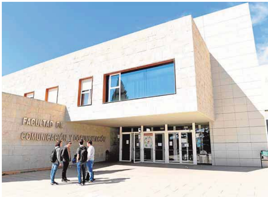
Facultad de Comunicación y Documentación. UMU

En la Universidad de Murcia, son ya ocho los centros que cuentan con este reconocimiento (ya