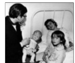
Umbral, junto a la niña, en 1966.