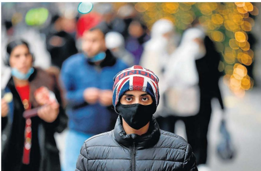
Un joven camina por la calle Oxford, en Londres, con un gorro con la bandera del Reino Unido.