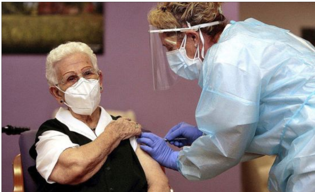
POOL / PEPE ZAMORA

• Todas las acciones cumplidas sin ostentación y sin testigos me parecen más loables (Cicerón) •