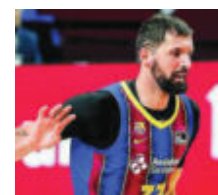
Mirotic fue decisivo