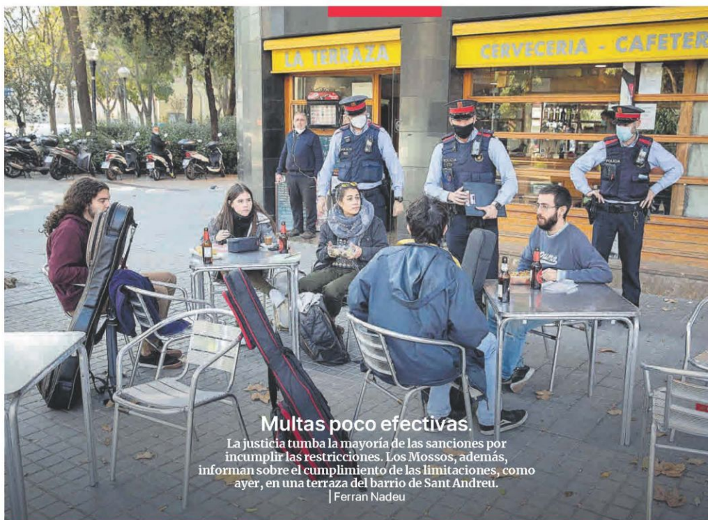
Multas poco efectivas. La justicia tumba la mayoría de las sanciones por incumplir las restricciones. Los Mossos, además, informan sobre el cumplimiento de las limitaciones, como ayer, en una terraza del barrio de Sant Andreu.