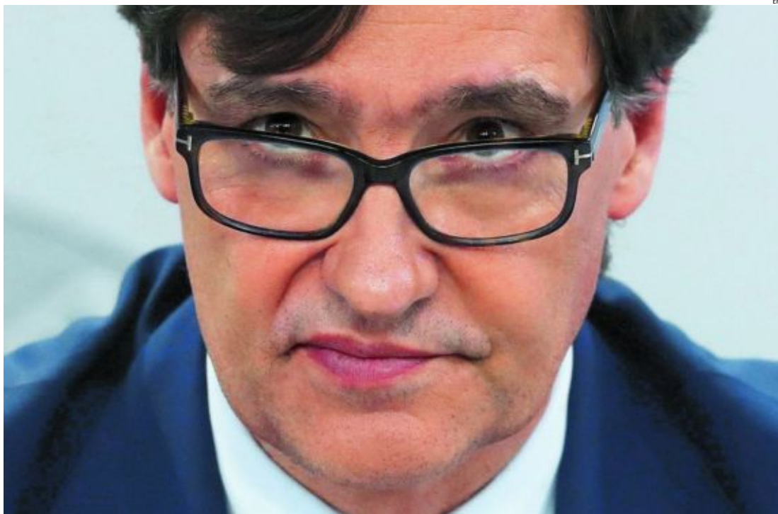
El ministro de Sanidad, Salvador Illa, ayer, durante la rueda de prensa para anunciar las medidas para las navidades de la Covid

Jueces piden que se deje de «controlar» la Justicia ESPAÑA 10