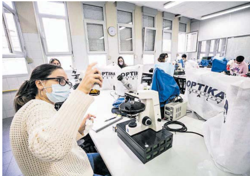
Una de las alumnas pulveriza con alcohol la óptica del microscopio antes de utilizarlo.

Oviedo, M. G. SALAS En una Universidad online, como es a la fuerza la de Oviedo desde hace justo un mes (desde el 3 de noviembre), las prácticas presenciales se ven como una “motivación” y una “ventaja”. No solo para alumnos, sino también para profesores. “Aprendemos mucho más y hay asignaturas que es imposible darlas a distancia”, aseguran los estudiantes. “Para nosotros, estas prácticas presenciales son esenciales: estar cara a cara con ellos y poder ver cómo evolucionan”, opinan también los docentes. Desde que la pandemia obligó a la institución académica asturiana a impartir todas sus clases online, solo algunas prácticas, consideradas esenciales o inaplazables, se desarrollan de forma presencial. La mayoría de ellas se corresponden con carreras de ciencias e ingeniería. LA NUEVA ESPAÑA ha acompañado a un grupo de segundo curso del grado de Geología a una de esas prácticas presenciales y las caras de todos los participantes fueron de felicidad. Ahora a nadie le da pereza ir a la Universidad, todos están deseando pisar la Facultad y reencontrarse con sus compañeros. “Supone una ventaja venir aquí, aprendemos mucho más. Y esta asignatura en concreto sería imposible darla online”, expresan Noa Pardo, de 19 años y natural de Lugo, y Antonio Affonso, de 21 y de Torrelavega. La asignatura se llama Petrología de Rocas Ígneas y Metamórficas, es