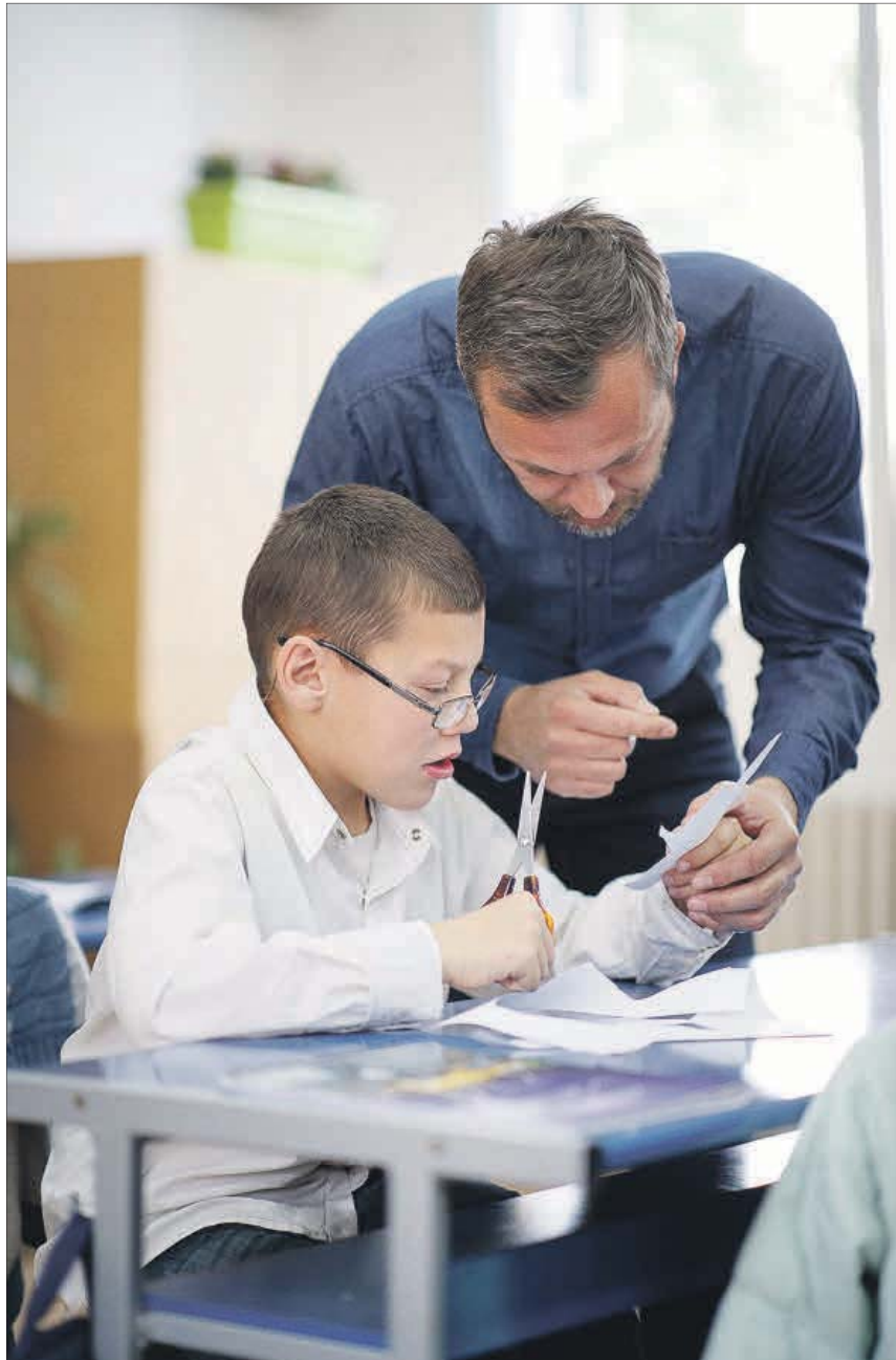
Estudiantes en un centro de Educación Especial.

Las críticas de las plataformas defensoras no han tardado en hacerse públicas, cargando contra la que consideran una ley que antepone la ideología al bien de los alumnos e ideada para tener el monopolio de la educación y el control de la persona. Escudero manifiesta que: "Lo que quiere la ministra es hacer un trasvase de la mayor parte del alumnado que está escolarizado en cen-