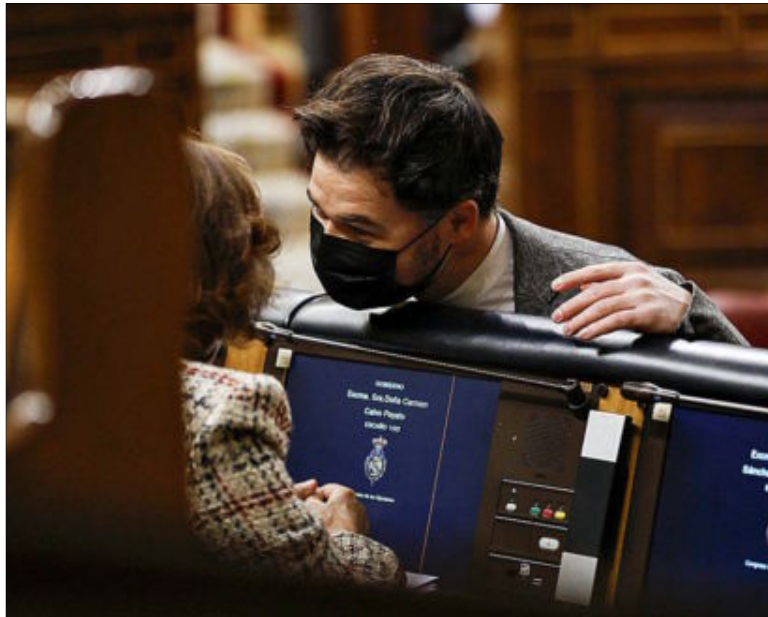
El diputado de ERC, Gabriel Rufián, habla con la vicepresidenta Carmen Calvo, ayer en el Congreso.

CARLOS SEGOVIA MADRID El Estado se ha convertido en el gran banco de la Generalitat de Cataluña con un importe que ha superado los 100.000 millones de euros desde 2012 hasta la fecha. La comunidad catalana llega a esa cifra tras una subida del 47% este año y es la principal beneficiaria de los fondos de liquidez para las regiones, al copar casi un tercio del total. A Madrid llegó un 1,4%. PÁG. 28 / EDITORIAL EN PÁG. 3