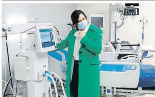
Ayuso inauguró ayer el hospital de pandemias sin apenas personal

d'Economia, propuso una alianza entre su comunidad y Catalunya para construir una "España de las Españas", con el objetivo de cambiar la estructura territorial y la financiación autonómica. POLÍTICA / P. 13 Y EDITORIAL