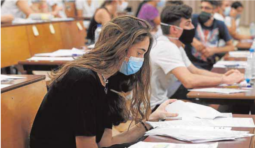
Alumnos durante el examen de selectividad de este pasado mes de julio. NIÑO SALAS