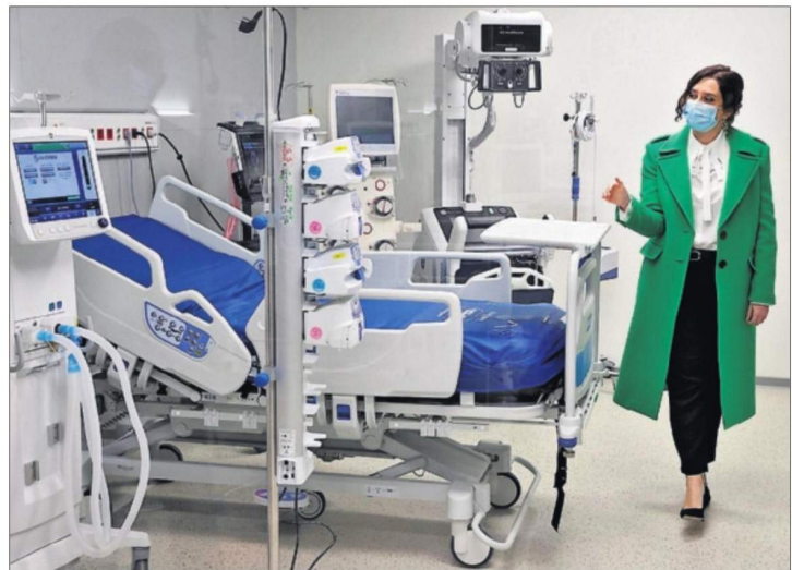
AYUSO INAUGURA EL CONTROVERTIDO HOSPITAL DE PANDEMIAS. Isabel Díaz Ayuso inauguró ayer en Madrid el hospital Enfermera Isabel Zendal. Los sindicatos critican que el centro carece de fin más allá de la actual crisis. Los enfermos llegarán tras el 8 de diciembre. / CHEMA MOYA (EFE) MADRID / EDITORIAL EN LA PÁGINA 10

Unidas Podemos quiere que el Gobierno acelere esta reforma legal y ha enviado un documento con su propuesta de nueva redacción del artículo 544 del Código Penal. PÁGINA 15