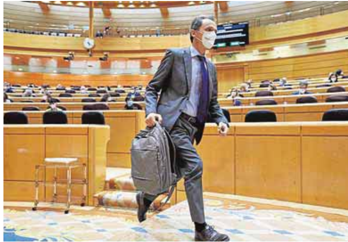
Duque, ayer, en la sesión de control al Gobierno en el Senado.