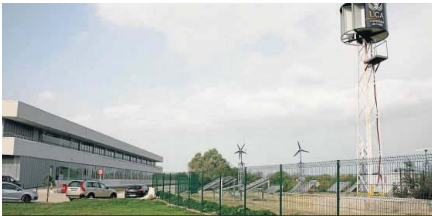
Exterior de la Escuela Superior de Ingeniería con el aerogenerador de eje vertical.