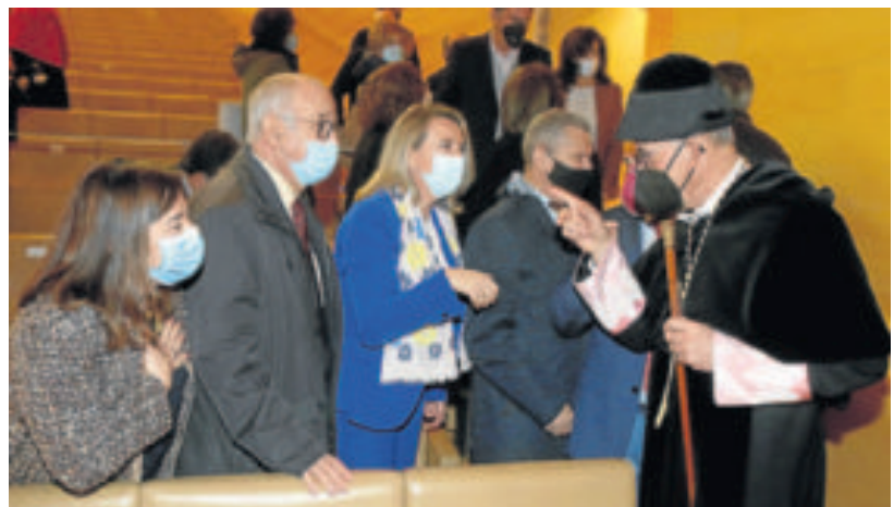
El nuevo rector saluda al consejero de Educación de La Rioja. J.M.

Y además de «convertir a la Universidad de La Rioja en uno de los principales motores del desarrollo social, cultural y económico de la Comunidad Autónoma», Ayala tildó de irrenunciable un segundo objetivo: la internacionalización. «La Universidad de La Rioja debe convertirse en un referente claro para que los estudiantes encuentren en nuestra universidad el lugar de excelencia que todos deseamos». Y ahí entra en juego el español que «debe ayudar a que la Universidad de La Rioja acoga presencial y virtualmente a todos aquellos