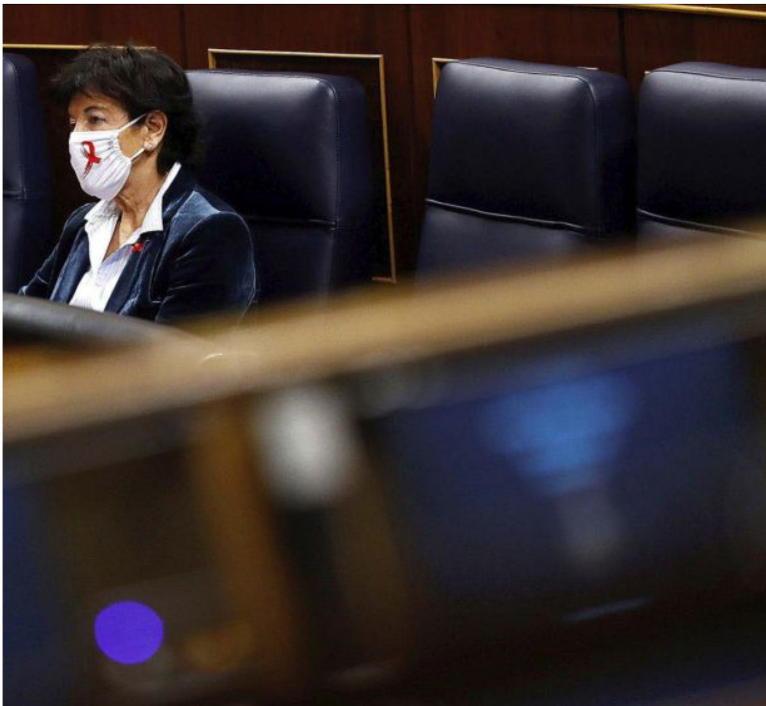
La ministra de Educación, Isabel Celaá, ayer, sentada en su escaño, durante el Pleno del Congreso sobre los Presupuestos.