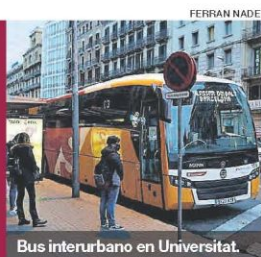
Bus interurbano en Universitat.

Cs rechaza las cuentas de Sánchez por los pactos con ERC y Bildu