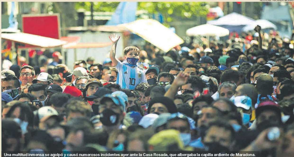
Una multitud inmensa se agolpó y causó numerosos incidentes ayer ante la Casa Rosada, que albergaba la capilla ardiente de Maradona.

UNA MAREA HUMANA DESPIDE AL ASTRO EN ARGENTINA | TEMA DEL DÍA ▶ 2 a 8