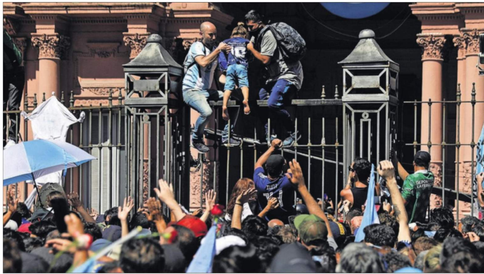
MULTITUDINARIO ADIÓS A MARADONA EN ARGENTINA. Decenas de miles de personas abarrotaron en Buenos Aires los alrededores de la Casa Rosada, el palacio presidencial, donde se instaló la capilla ardiente del futbolista, fallecido el miércoles a los 60 años. Las colas para rendirle honores medían kilómetros y las normas de distancia social saltaron por los aires. PÁGINAS 32 A 39 / EDITORIAL EN LA PÁGINA 10