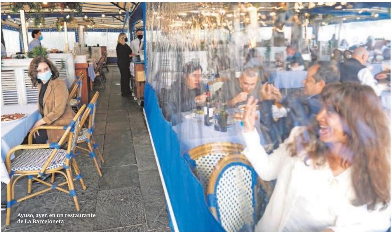
Ayuso, ayer, en un restaurante de La Barceloneta