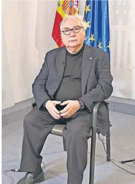
El ministro de Universidades, Manuel Castells.

"He reclamado en distintos foros la propuesta planteada ya que evitaría la proliferación de iniciativas con el nombre de universidad que no lo merecen, ahora quiero que se pruebe para el año que viene", afirmó haciendo hincapié en que no comparte los plazos para la entrada en vigor de los cambios, puesto que se está barajando entre 3 y 5