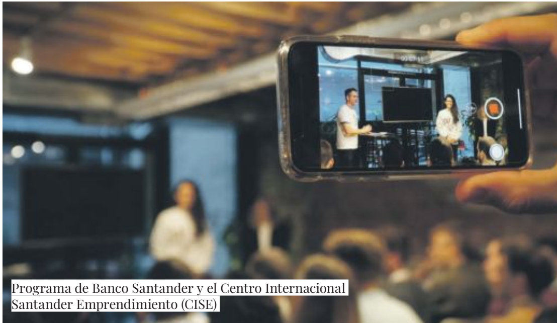
Programa de Banco Santander y el Centro Internacional Santander Emprendimiento (CISE)