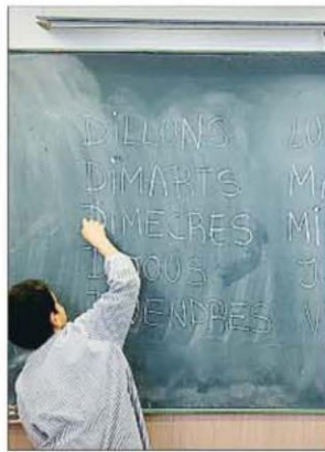
La atención a la diversidad, a debate

Se trata de los alumnos con trastorno específico del lenguaje (TEL), un trastorno grave y duradero, presente entre el 2 y 7 por ciento de los menores, que afecta a la adquisición del lenguaje desde sus inicios. Puede concernir a uno, varios o todos los componentes del sistema lingüístico (fonología, morfosintaxis, semántica y/o pragmática). "A diferencia de la dislexia, que afecta al lenguaje escrito, los alumnos con TEL tienen afectado el lenguaje oral lo que