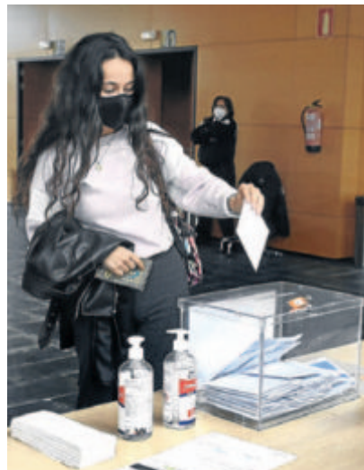
Una alumna deposita ayer su voto. LUIS ÁNGEL GÓMEZ

Años: 1991-1996 Viceconsejero: Médico cirujano formado en Salamanca, además de profesor, vicerrector y rector en la UPV/EHU, fue viceconsejero de Sanidad y Consumo desde 1984 hasta 1987.