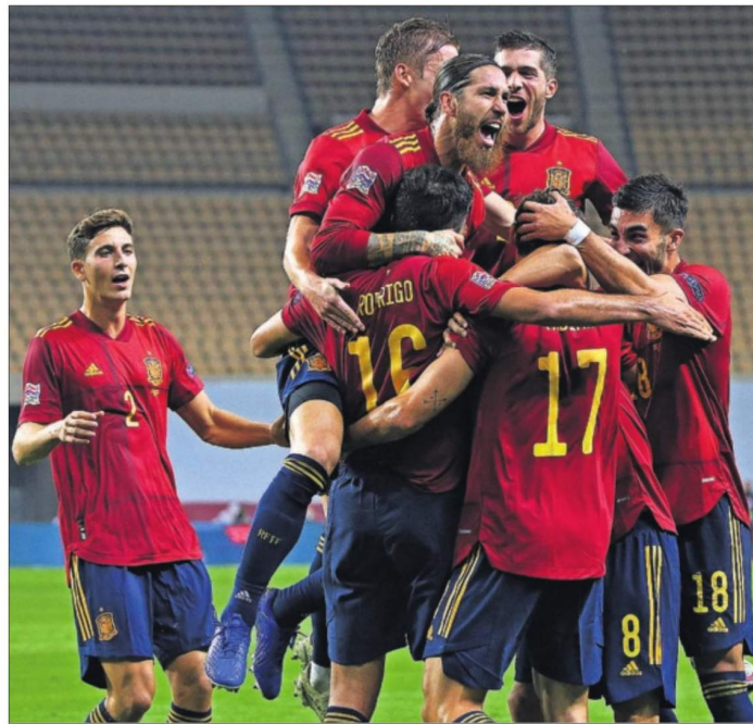
ESPAÑA ENDOSA A ALEMANIA UN 6-0 PARA LA HISTORIA. La selección española rejuvenecida por Luis Enrique vaporeó ayer en Sevilla a los germanos, un equipo también en transición, para alcanzar la fase final de la Liga de Naciones. Tres goles de Ferran Torres y los de Morata, Rodri y Oyarzabal completaron el vendaval de la Roja. En la foto, los jugadores celebran el tanto de Rodri. PÁGINAS 34 A 36

El PSOE intenta, de momento sin éxito, evitar la polémica desencadenada por el apoyo de EH Bildu al primer trámite presupuestario. El presidente Pedro Sánchez evitó ayer contestar a las descalificaciones que le regaló el PP en el Senado a cuenta del apoyo abertzale a la coalición de gobierno. PÁGINAS 14 Y 15