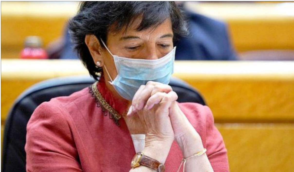
La ministra de Educación, Isabel Celaá, ayer en la sesión de control al Gobierno en el Senado.