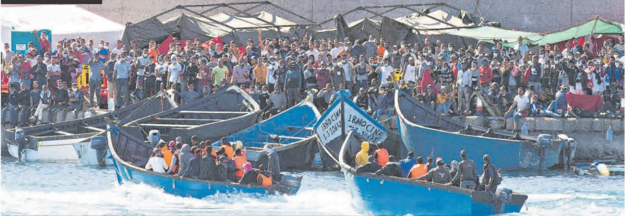
Los migrantes abarrotan un campamento provisional en un muelle de Las Palmas, mientras siguen llegando pateras, ayer.