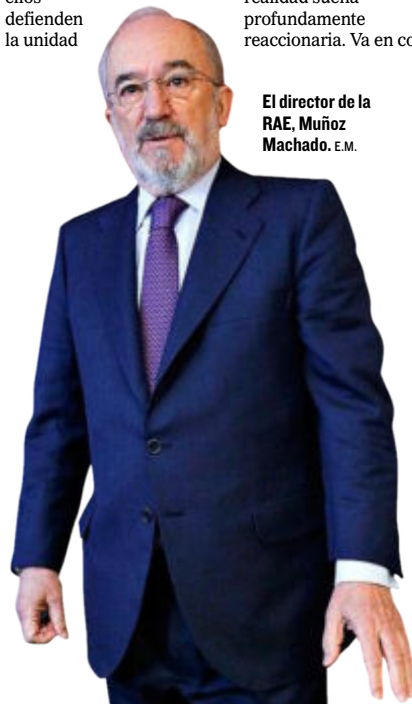
El director de la RAE, Muñoz Machado.

“LA RAE NO DEBATE SOBRE LA LEY, SINO SOBRE LA IMPORTANCIA DE LA LENGUA COMÚN”