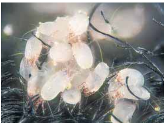
Un grupo de ácaros del polvo, de los más comunes del género. WIKIPEDIA

de Navarra y reconocer si las especies son las mismas en otros climas y en zonas urbanas, periurbanas y rurales".