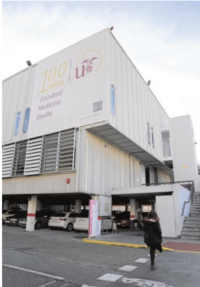
Fachada de la Facultad de Medicina de la Hispalense

La facultad, que actualmente es sede de dos titulaciones, Medicina y Biome-