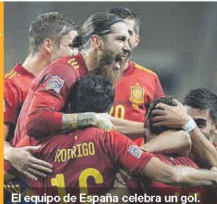
El equipo de España celebra un gol.

Patronal y sindicatos apremian al Gobierno a capitalizar las pymes