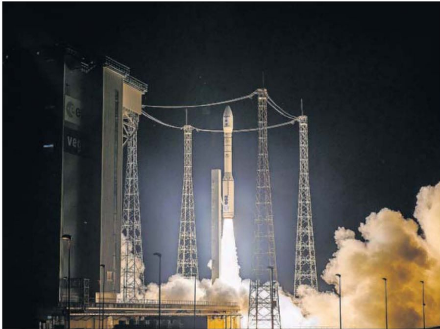
Lanzamiento del cohete Vega, el lunes en el Puerto Espacial de Kourou, en la Guayana Francesa.