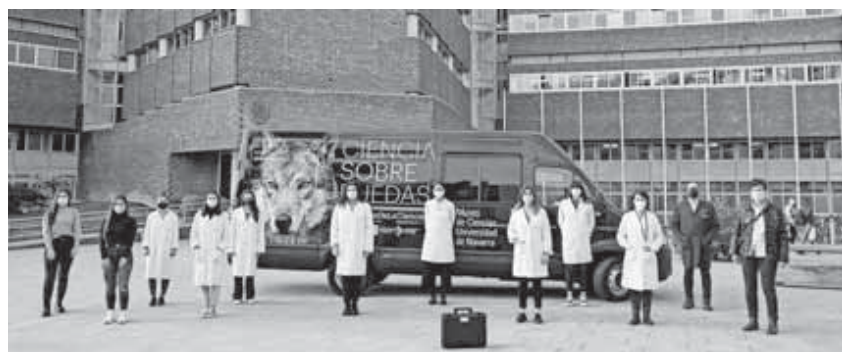
Los científicos y divulgadores, con la furgoneta con la que visitarán los colegios.