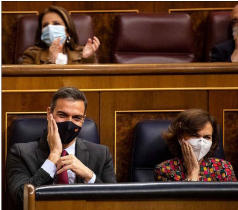
Pedro Sánchez y Carmen Calvo gesticulan ayer en sus escaños durante el pleno de Presupuestos en el Congreso. P001

Esta alianza con Bildu se consumó el mismo día en que se supo que el Gobierno ha acercado a cárceles más próximas al País Vasco a otros cinco presos de ETA, entre ellos a dos condenados por el asesinato en Sevilla del concejal del PP Alberto Jiménez-Becerril y su mujer. PÁGINAS 4 Y 5 / EDITORIAL EN PÁGINA 3