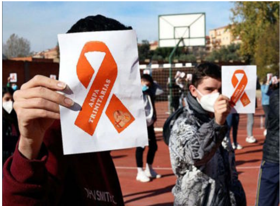
Un grupo de alumnos del colegio Santísima Trinidad de Salamanca protestan contra la Ley Celaá, ayer.

El año pasado esta dispensa se justificaba porque los colegios e institutos estuvieron cerrados a partir de marzo y muchos estudiantes no