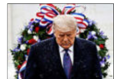
Trump, ayer, en Arlington.