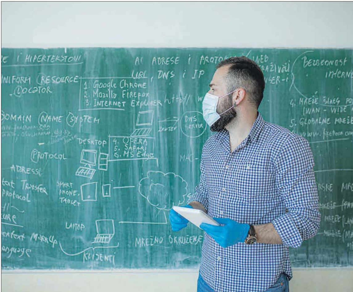
Profesor impartiendo una clase. DIEGO G. COTRINA

Según el Observatorio del Sistema Universitario, en el curso 2018-2019 había aumentado un 25,6% la figura de docente temporal, con respecto al curso 2013-2014. El informe de esta plataforma apunta que las universidades de 12 comunidades autónomas superan el tope del 40% fijado para el profesorado temporal por la Ley Orgánica de Universidades (LOU) y siete de ellas rebasan el 50%, es decir, tienen más docentes contratados que funcionarios.