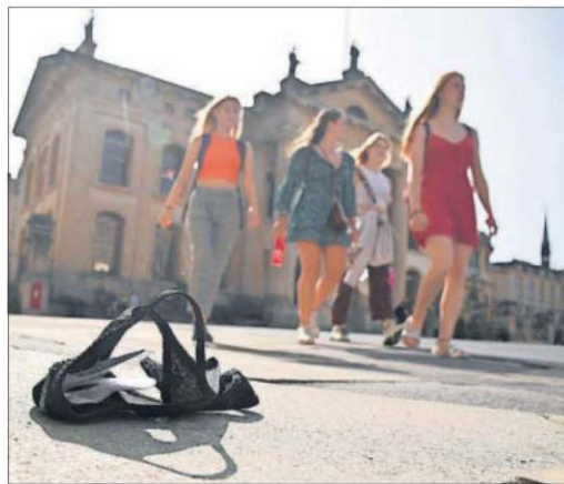
Una mascarilla tirada en el suelo, en la Universidad de Oxford.

Además del esfuerzo extra de reprogramar sus clases de un modo virtual, las dos principales preocupaciones de las universidades ante las recomendaciones del Gobierno tienen que ver con la puesta en marcha masiva de test, y, sobre todo, con la planificación del regreso a las aulas. Piden al Gobierno "unas instrucciones más claras respecto al regreso al campus en Año Nuevo, para asegurar que los alumnos se enfrenten al menor número de obstáculos tanto en los estudios co-