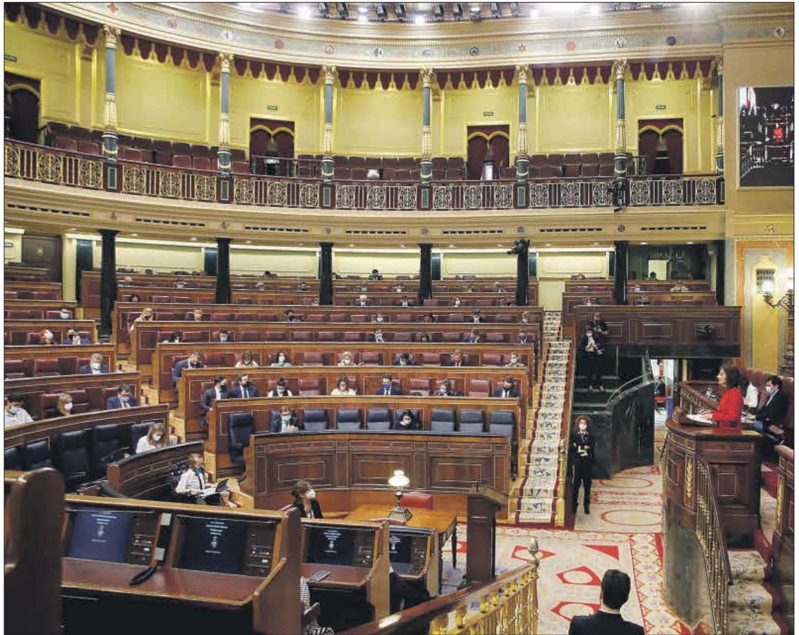
La ministra de Hacienda, María Jesús Montero, durante su intervención en el pleno del Congreso este miércoles donde se debaten las enmiendas al proyecto de Presupuestos Generales del Estado de 2021.

La titular de Educación reivindicó la autonomía de la educación en cuanto a la posibilidad de que se pudiera modificar la enmienda sobre el castellano para conseguir el apoyo de Ciudadanos en los Presupuestos. Manifestó: “El presupuesto es merecedor, por sí mismo, de enmiendas parciales, pero la educación merece un respeto, es autónoma, ese es el ambiente en el que tenemos que trabajar”. En su opinión, el proyecto de ley “tiene elementos suficien-