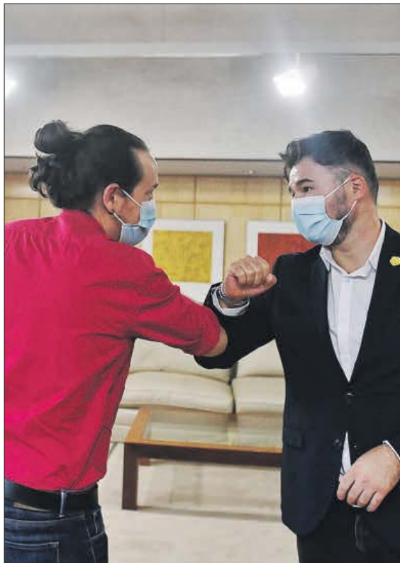
Pablo Iglesias y Gabriel Rufián.

tes como para poder incorporar opiniones diversas y sacar una suma de acuerdos”.