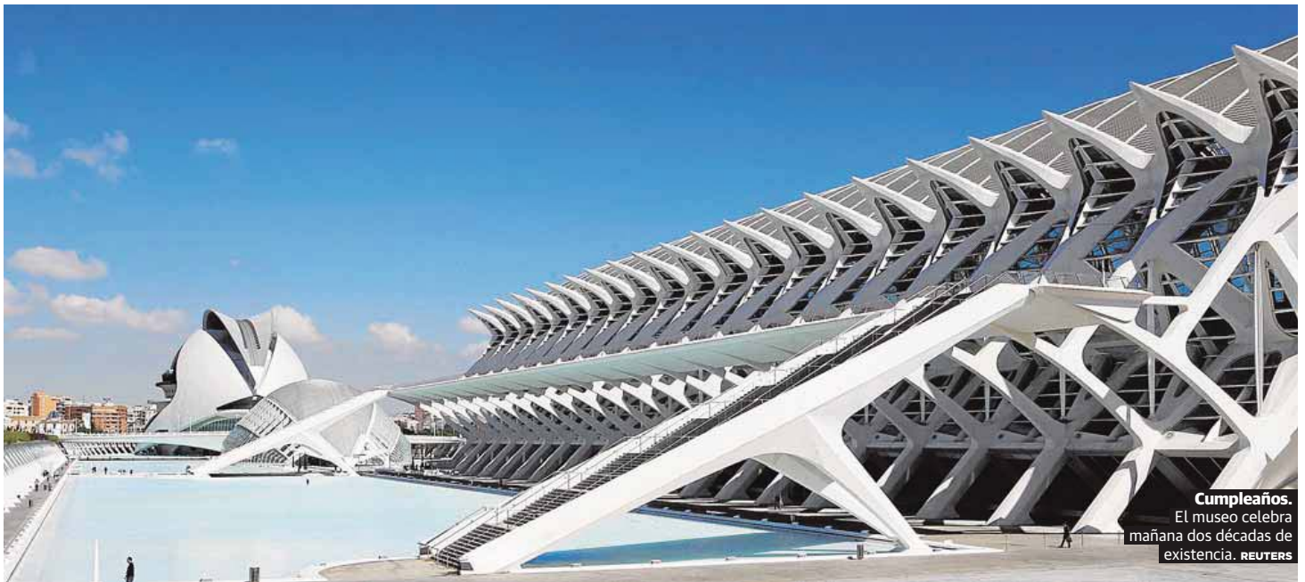
Cumpleaños. El museo celebra mañana dos décadas de existencia.