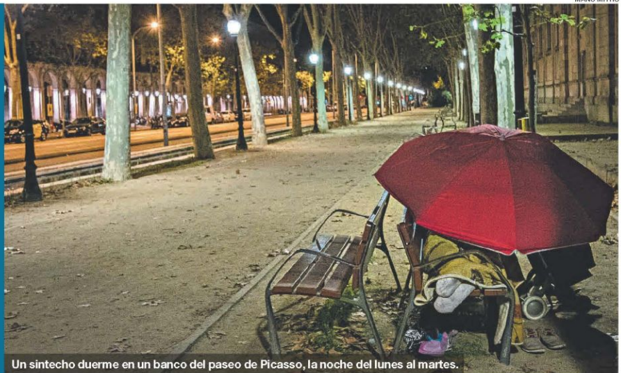
Un sintecho duerme en un banco del paseo de Picasso, la noche del lunes al martes.