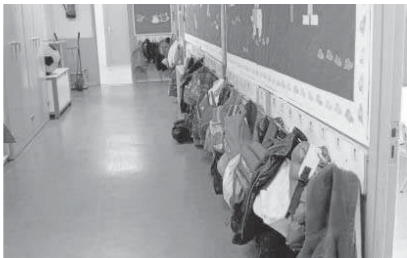
Un grupo de mochilas de los alumnos cuelgan de una percha en un centro educativo andaluz.

● La investigación de la UCO analiza qué factores aumentan la probabilidad de tener comportamientos incívicos en la etapa adulta