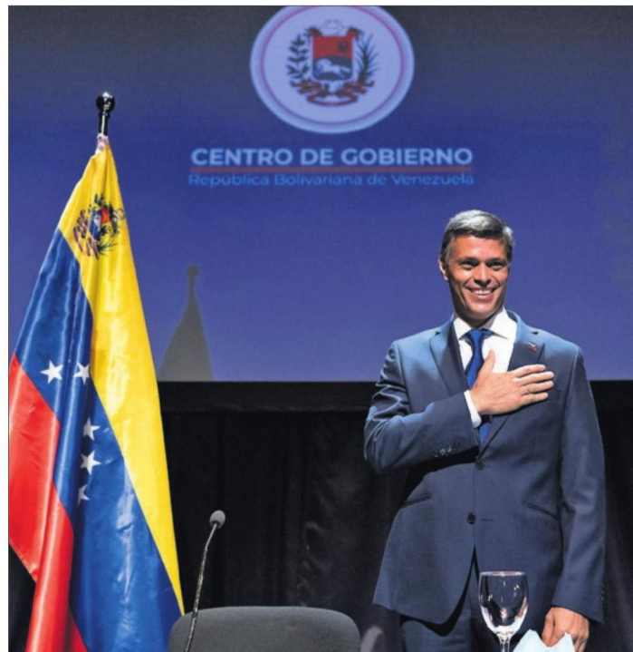
Leopoldo López, ayer en Madrid en un acto bajo el logo de la Administración de Juan Guaidó.

El periodismo necesita a los buenos periodistas