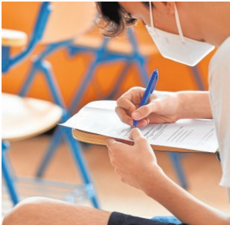
Un alumno de un instituto de Almería realiza un examen JUAN CARLOS SOLER

El texto señala concretamente: «El alumno o la alumna podrá permanecer en el mismo curso una sola vez y dos veces como máximo a lo largo de la enseñanza obligatoria». Según fuentes parlamentarias, la enmienda tiene muchas posibilidades de aprobarse porque