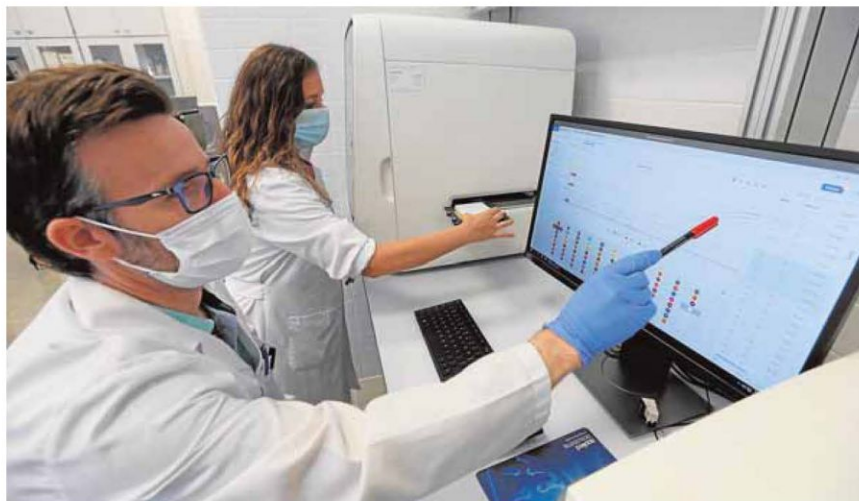
Los técnicos, con el equipo de PCR en tiempo real analizando los resultados. A la derecha, uno de los laboratorios biológicos. SALVADOR SALAS