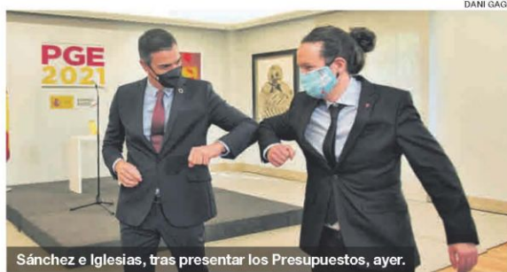
Sánchez e Iglesias, tras presentar los Presupuestos, ayer.

Compromiso de limitar los alquileres y mejora del ingreso mínimo vital