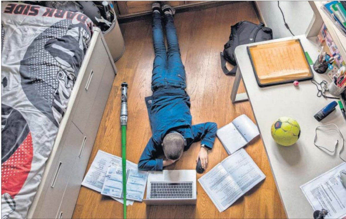
Un alumno de quinto de primaria estudia en casa durante el confinamiento de la pasada primavera, en Barcelona.