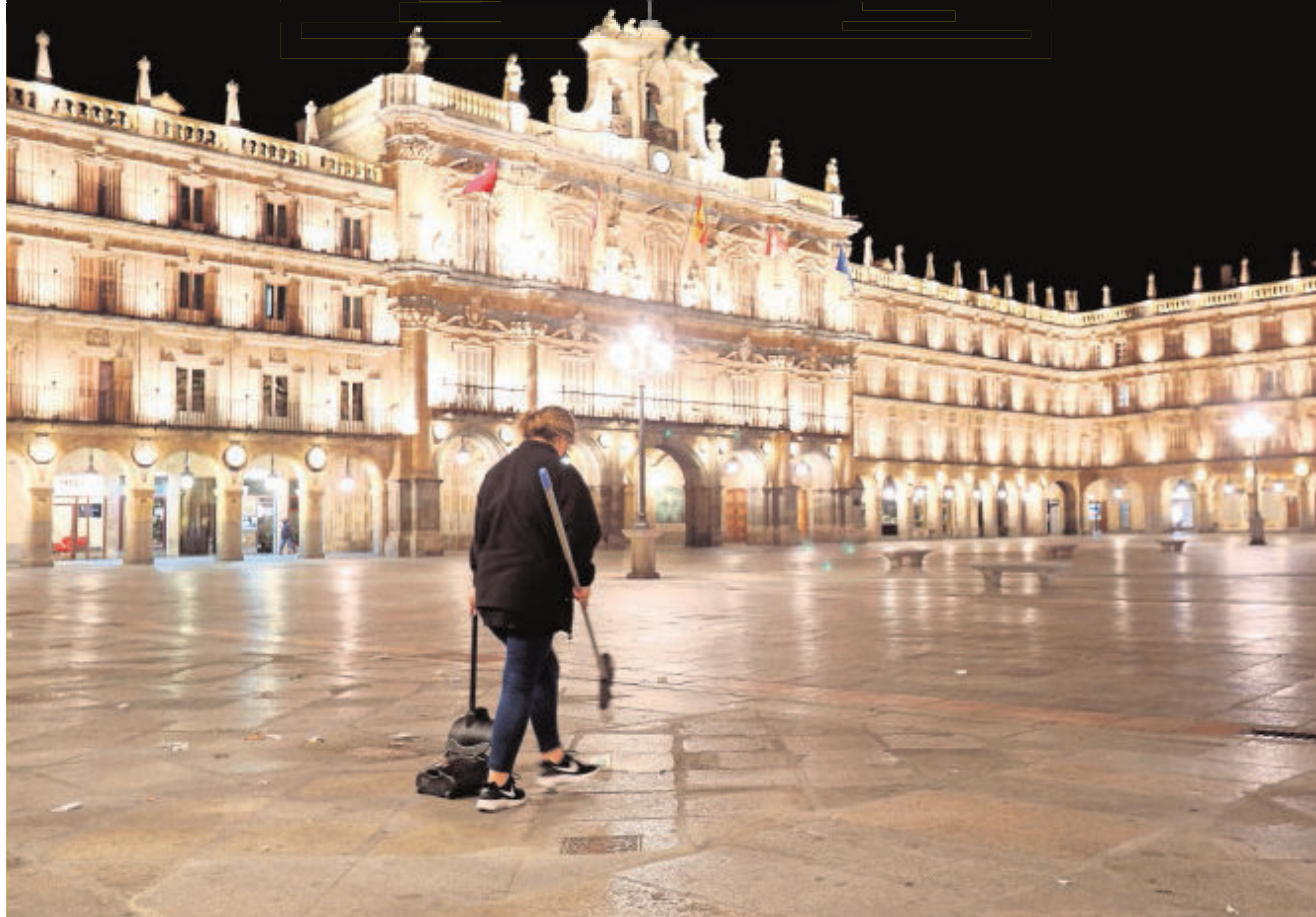
Plaza Mayor de Salamanca, en su primera noche de toque de queda decretado por la Junta de Castilla y León

Se prohíbe estar en la calle desde las 0.00 hasta las 6.00 horas