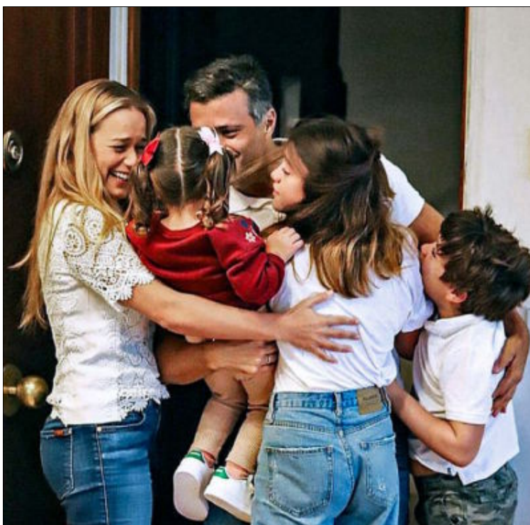
El líder opositor Leopoldo López, abrazado ayer por su mujer y sus hijos en Madrid. EM