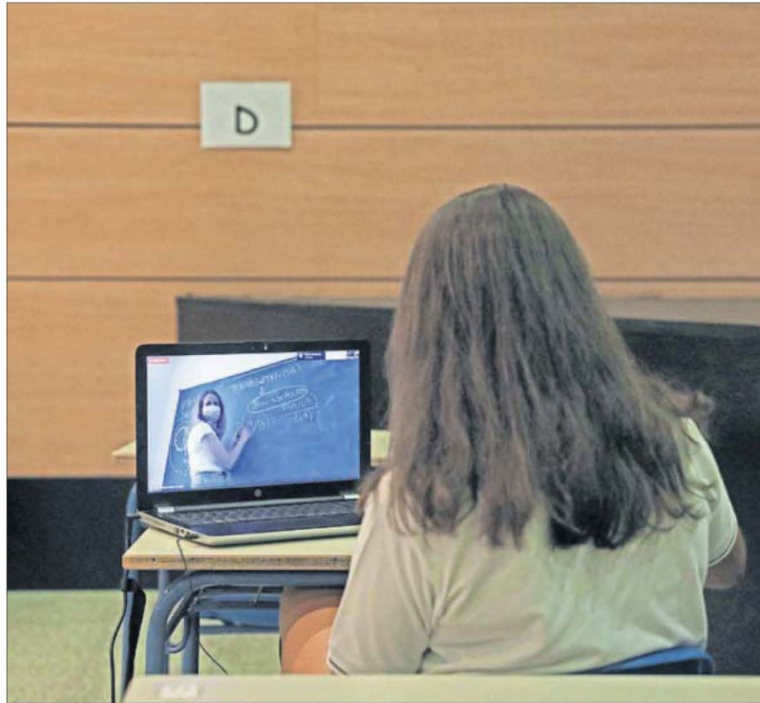
Una alumna atiende en su ordenador a una clase de 4º de la ESO en Madrid, en septiembre.