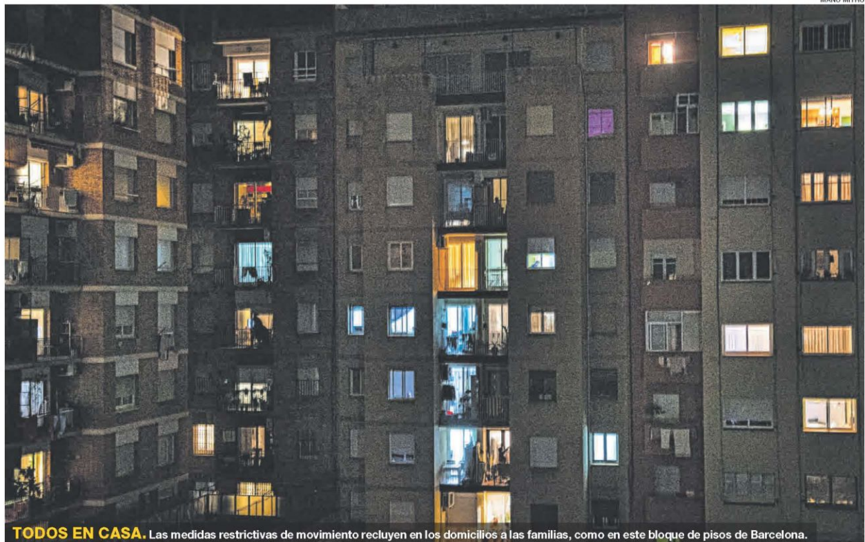
TODOS EN CASA. Las medidas restrictivas de movimiento recluyen en los domicilios a las familias, como en este bloque de pisos de Barcelona.

5 RESTAURANTES ▶ El Govern permite cines y comida a domicilio hasta las 22 horas