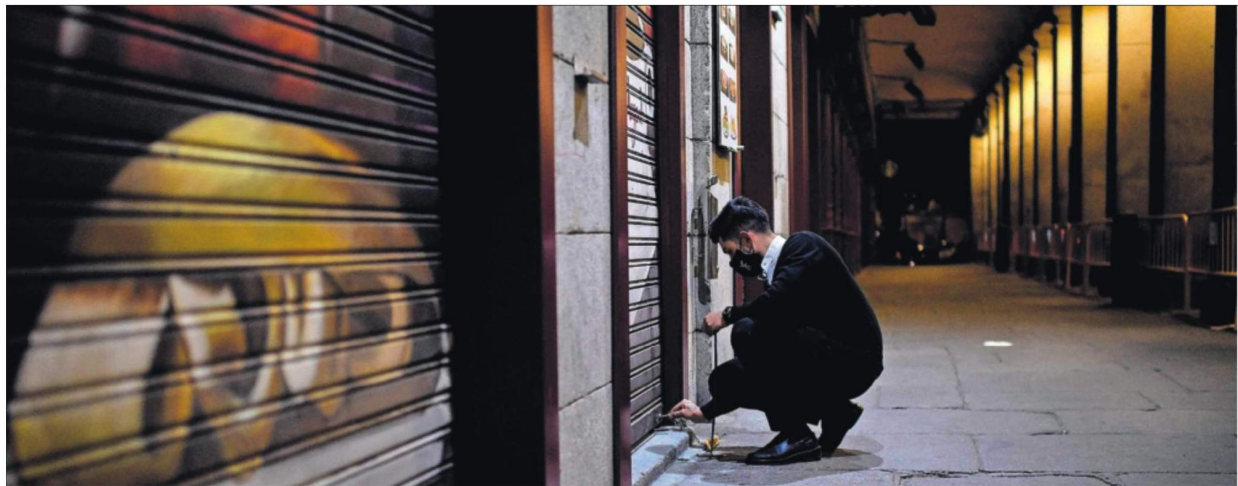
Un empleado echaba la noche del sábado el cierre a un bar de la Plaza Mayor de Madrid. La hostelería se enfrenta a meses de restricciones de horarios y aforos.