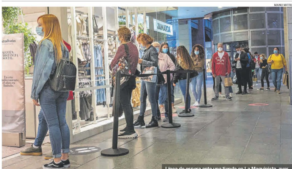
Línea de espera ante una tienda en La Maquinista, ayer.