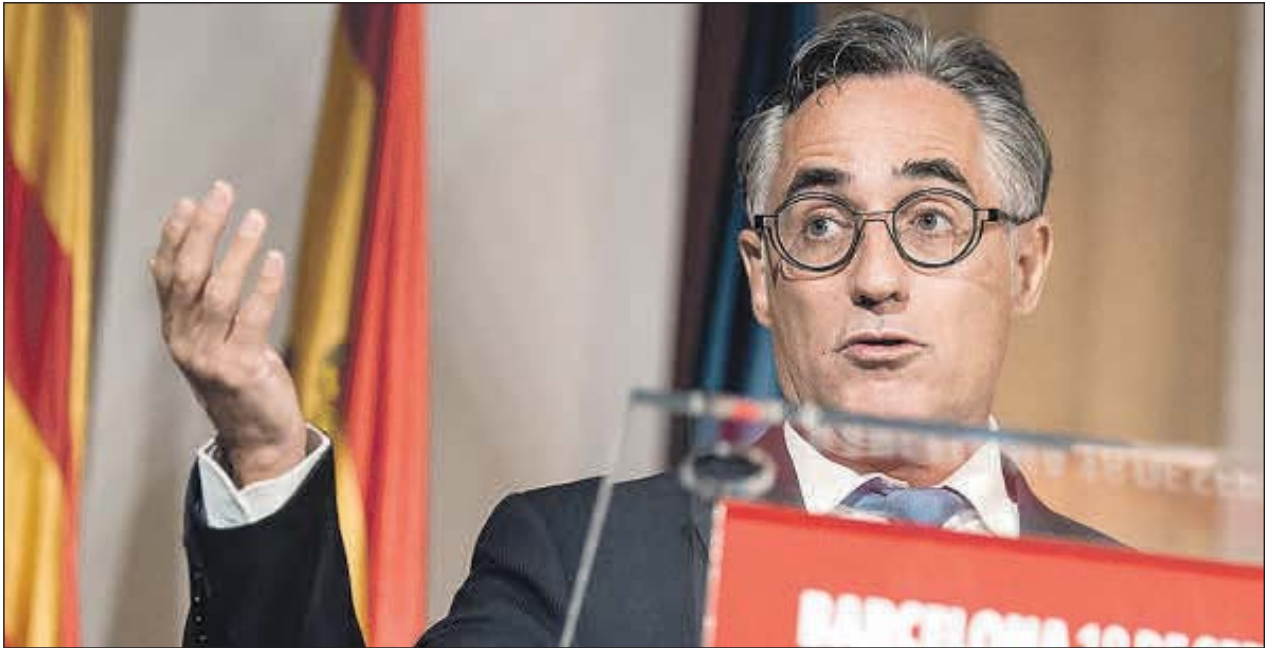
Ramon Tremosa, consejero de Empresa y Conocimiento de la Generalitat de Cataluña.