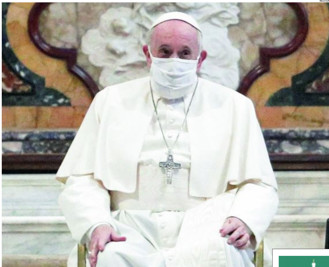
El Pontífice apareció ayer por primera vez con mascarilla por la oleada de covid en el Vaticano

España alcanza el millón de contagios y se sitúa a la cabeza de la UE ESPAÑA 8