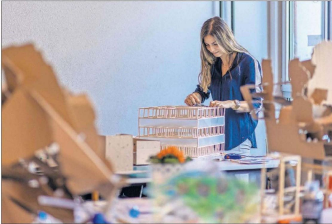
Una estudiante de arquitectura trabaja en un proyecto en la Universidad Europea de Madrid.

El documental 'New Jobs' de Funcas ahonda en las nuevas perspectivas formativas y laborales de la sociedad