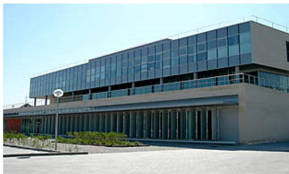
La UPM celebra sus 50 años. eE

Lenovo dotará de dos servidores Thinksystem SR670 diseñados para cargas de inteligencia artificial para probar en ellos modelos de Deep learning en el cluster de supercomputación de la UPM. Por último, la compañía tecnológica y este campus madrileño se comprometen a buscar financiación y socios para el desarrollo de proyectos de I+D conjuntos.