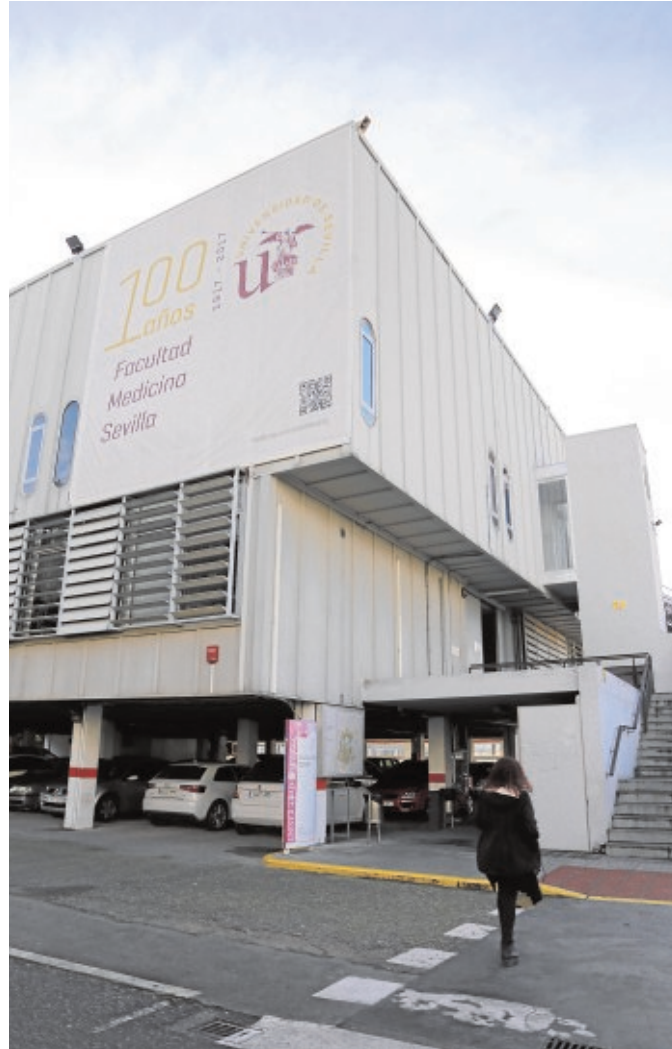
Edificio de la facultad de Medicina en Sevilla

En este sentido, afirman que todos están de acuerdo en que estas actividades son la base de su formación como futuros médicos y biomédicos,