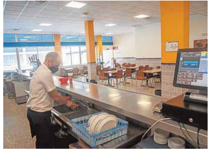
La cafetería de Medicina, vacía a la hora del desayuno. FRANCIS SILVA