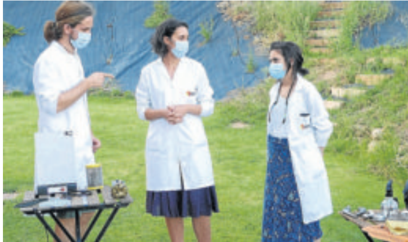
Las investigadoras realizaron diferentes experimentos. INMA

El pasado 10 de octubre, científicas e investigadores del Instituto de Nanociencia y Materiales de Aragón –centro mixto entre el CSIC y la Universidad de Zaragoza– visitaron la localidad oscense de Loporzano para dar a conocer la labor del instituto y la investigación más puntera en nanociencia y ciencia de materiales en el medio rural. Una