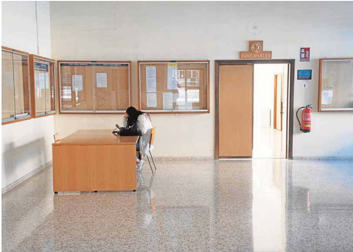
Una zona casi vacía en la Facultad de Medicina, que ha pasado a 'online' toda la docencia de asignaturas teóricas. FRANCIS SILVA