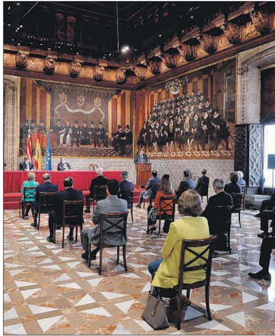
Los premios se anunciaron ayer en el Palau de la Generalitat de Valencia.