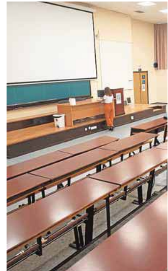
▲ Medicina. Aulas vacías y estudiantes sin clases. F. SILVA