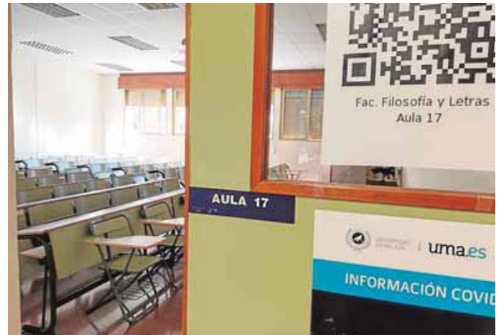
Filosofía y Letras, sin clases presenciales para la mayoría. FRANCIS SILVA

estudiantes de segundo de Criminología. Los grupos están divididos, con la mitad en el aula y el resto en casa siguiendo la clase en directo. «Dentro de lo malo, es lo mejor», dicen las jóvenes. En Económicas están divididos por semanas, y a clase acude la mitad del grupo. Pero los alumnos se quejan de una cierta desorganización. «Hay días que tengo una clase presencial, y justo cuando acaba tengo una 'on line', sin tiempo para llegar a casa», explica Mirreya, estudiante del doble grado ADE y Económicas.