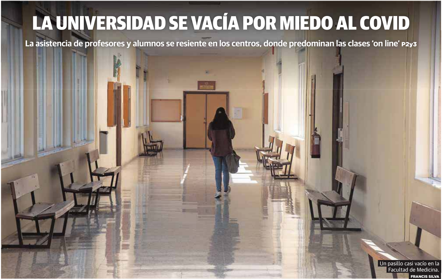
Un pasillo casi vacío en la Facultad de Medicina. FRANCIS SILVA

La asistencia de profesores y alumnos se resiente en los centros, donde predominan las clases 'on line' p2y3