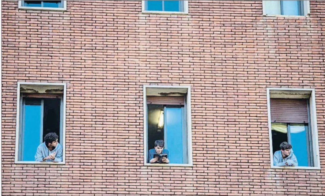
Algunos estudiantes confinados en el colegio mayor Penyafort-Montserrat se asomaban ayer a las ventanas de sus habitaciones

El Govern se reunió ayer con los rectores para pedirles que contribuyan a evitar la propagación