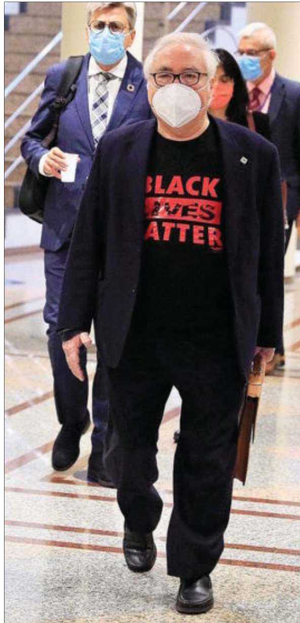
El ministro de Universidades, Manuel Castells.

Castells se ha autoenmendado a sí mismo en su tercer borrador y ha endurecido las condiciones para los