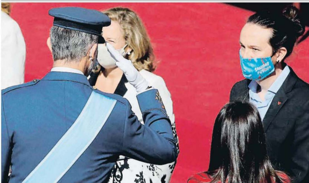
EL 12-O DE LA COVID-19 Y LA TENSION POLÍTICA

A China no le tiembla el pulso a la hora de tomar medidas drásticas para combatir la pandemia. Tras detectar un brote de solo 12 personas en la ciudad turística de Qingdao, las autoridades van a hacer pruebas PCR a sus más de nueve millones de habitantes en el plazo de cinco días. El brote ha surgido en un hospital. INTERNACIONAL / P. 8