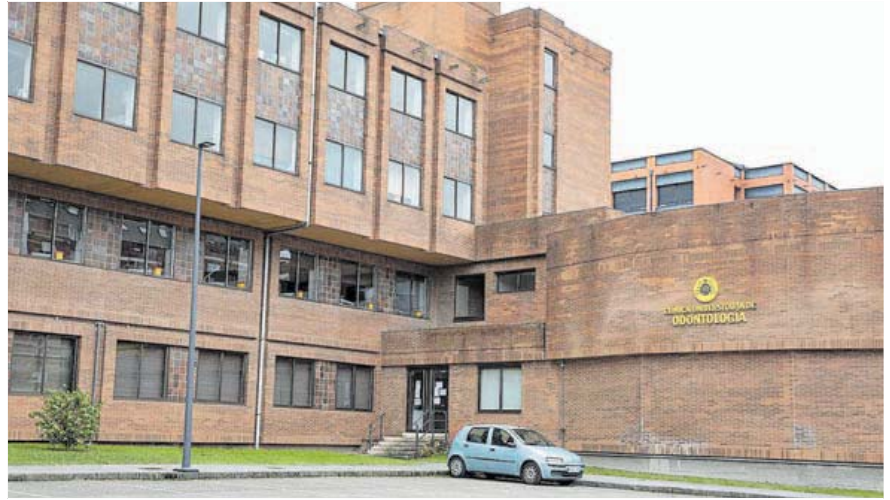
Instalaciones de la Clínica Universitaria de Odontología, detrás de la Facultad de Medicina.

La alarma saltó el pasado jueves cuando se tuvo constancia del primer positivo y al menos otros seis contactos estrechos, pero en el fin de semana en la institución académica ya se tenía constancia de,