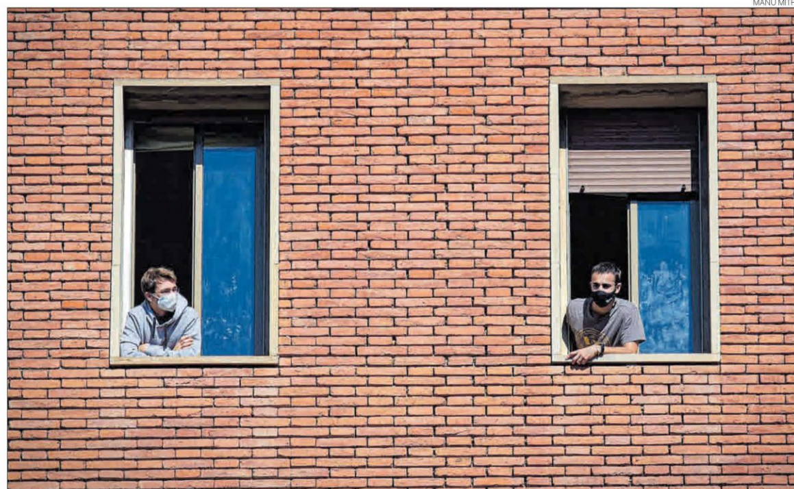
► Dos residentes del colegio mayor Penyafort-Montserrat, asomados a sus ventanas, ayer.