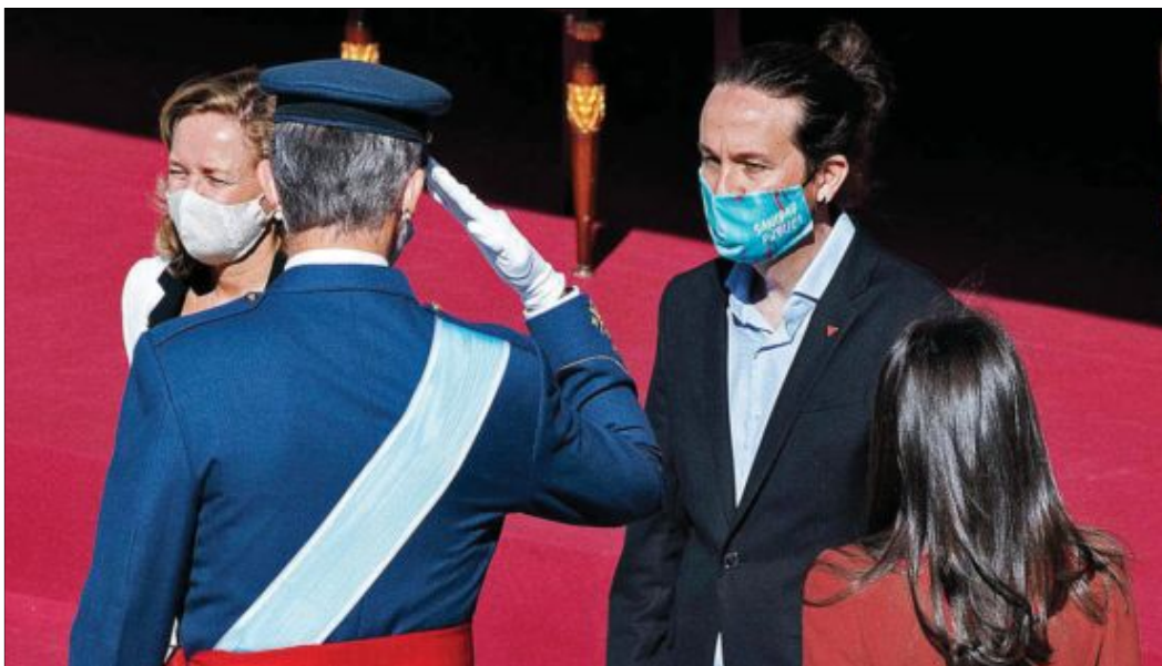
Los Reyes Felipe VI y Letizia saludan al vicepresidente Pablo Iglesias, en presencia de la ministra de Economía, Nadia Calviño, ayer, en el Palacio Real.