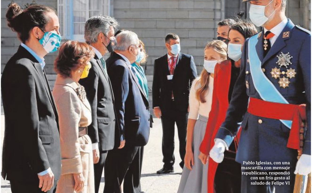
Pablo Iglesias, con una mascarilla con mensaje republicano, respondió con un frío gesto al saludo de Felipe VI

Don Felipe presidió la celebración de la Fiesta Nacional más tensa por la gestión de la pandemia y los ataques de Podemos a las instituciones