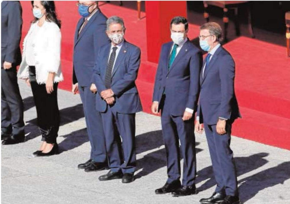
Moreno charla con el presidente gallego, Alberto Núñez Feijóo, en los actos del Día Nacional