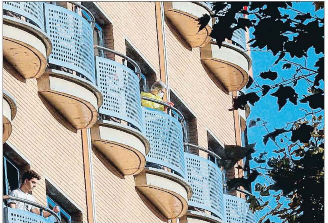
Personal de limpieza y uno de los 600 jóvenes confinados, asomándose en los balcones del colegio mayor

La empresa podría acabar con una sanción por una infracción muy grave, y que conlleva una multa de 30.001 a 60.000 euros según el decreto ley 11/2020, de 24 de julio, del consejo de régimen sancionador específico contra los incumplimientos de las disposiciones regu-