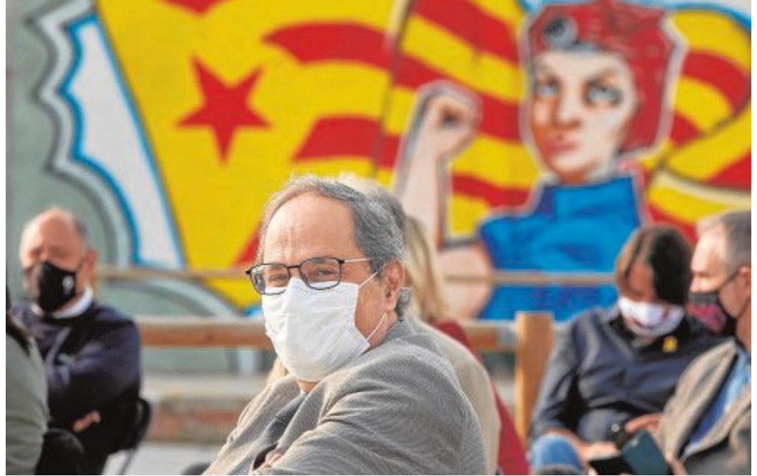
Quim Torra, en un acto en Cornellà del Terri (Gerona) el pasado 1 de octubre

En paralelo a la publicación de este nuevo comunicado, ayer seguía creciendo la polémica en torno a la UB. Al respecto, el rector de esta universidad