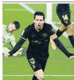
Messi celebra con rabia su gol

tiva prevista para el 12 o el 13 de octubre. Ayer 7.000 de las firmas habían pasado el corte. Se necesitarían 9.521 más para que prosperase la moción, y faltan 12.000 por verificar. DEPORTES / P. 42