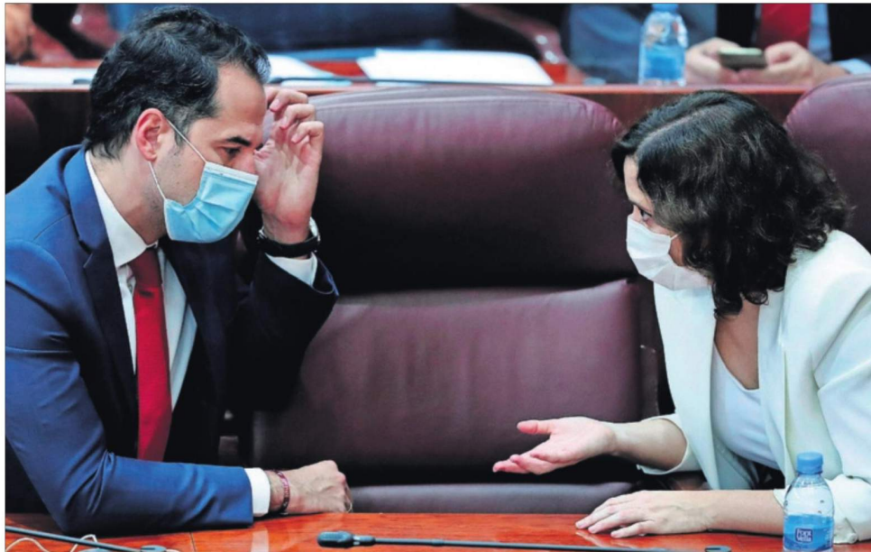
Isabel Díaz Ayuso, presidenta de Madrid, y el vicepresidente Ignacio Aguado, ayer en el pleno de la Asamblea regional.

en su mayoría por motivos laborales. Mientras, la guerra abierta por Ayuso contra el Gobierno genera fisuras en el seno del PP y complica su relación con Ciudadanos. PÁGINAS 14 Y DE 20 A 23 EDITORIAL EN LA PÁGINA 10