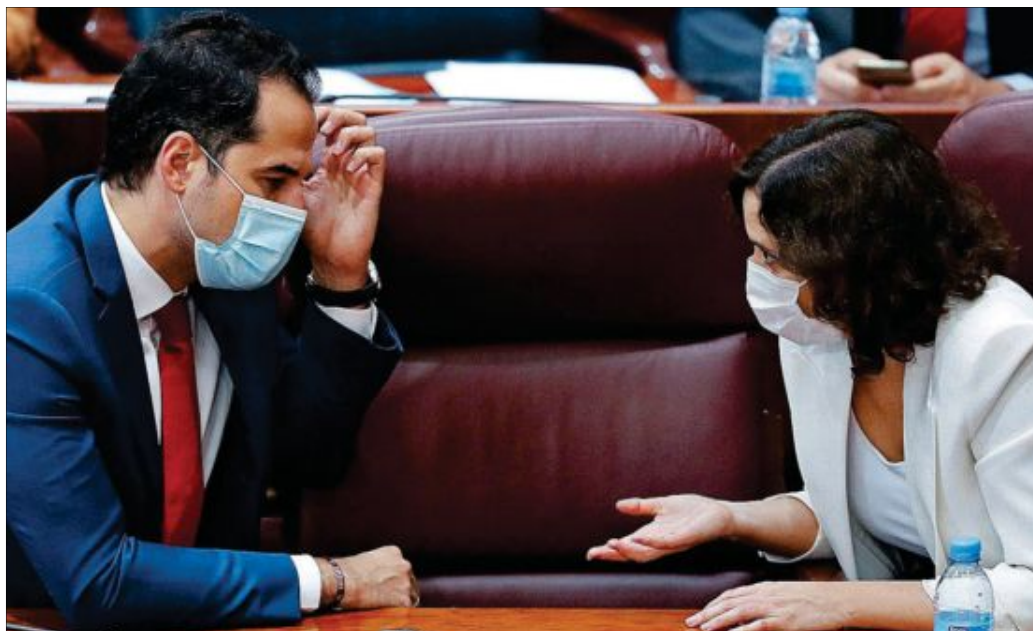
El vicepresidente de la Comunidad de Madrid, Ignacio Aguado, conversa con la presidenta, Isabel Díaz Ayuso, ayer en la Cámara autonómica.