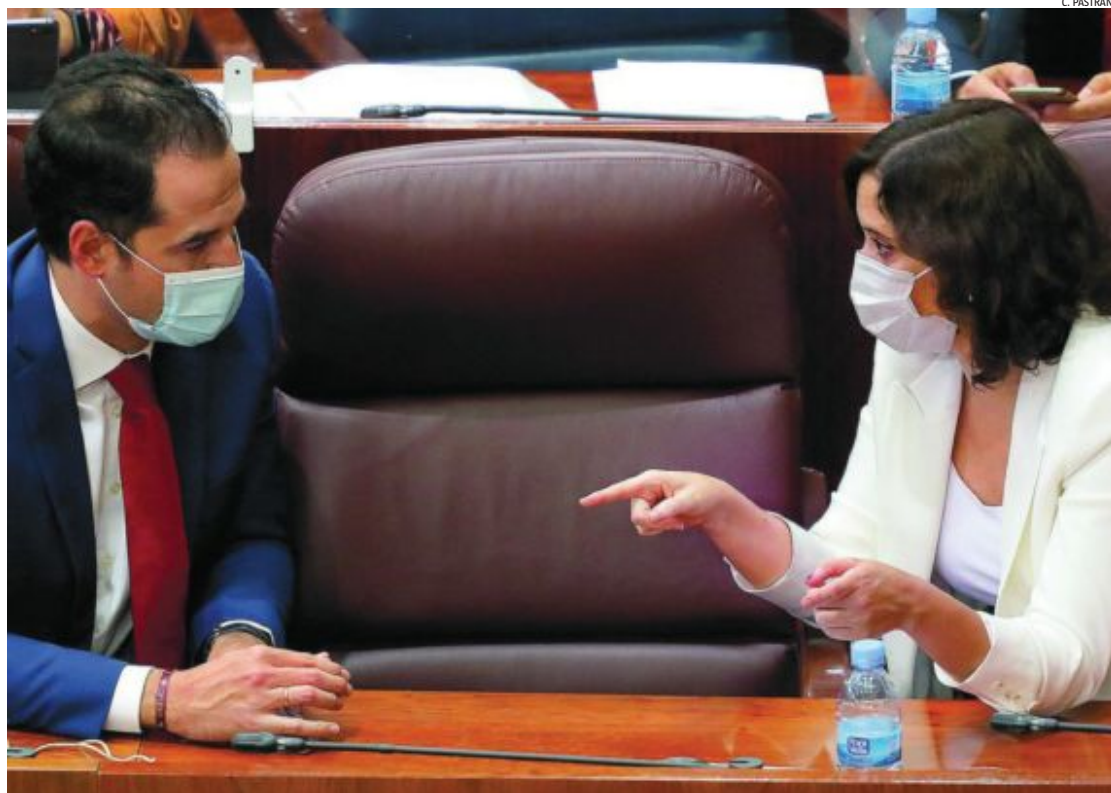
La presidenta Isabel Díaz Ayuso y el vicepresidente de la Comunidad de Madrid, Ignacio Aguado, ayer en la Asamblea de la capital