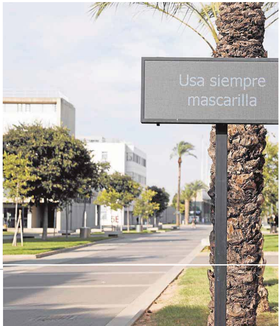
Dos estudiantes pasean por el campus de la Universitat Politècnica de Valencia. IVÁN ARLANDIS

El responsable del colegio mayor hizo hincapié en la colaboración con Salud Pública, Sanidad y la UPV para establecer los pa-