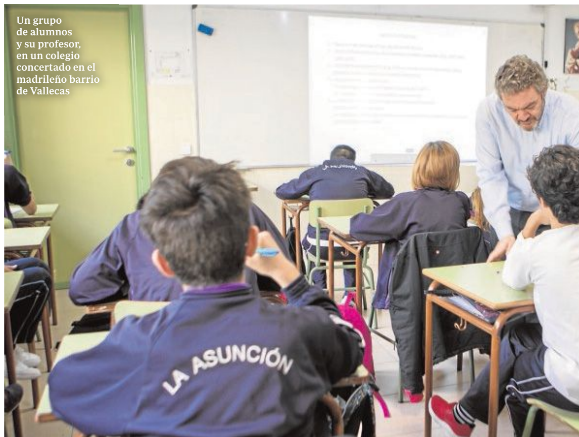
Un grupo de alumnos y su profesor, en un colegio concertado en el madrileño barrio de Vallecas

Una situación similar ocurriría con la sanidad privada. Las familias que se vean forzadas a abandonar su seguro médico por la subida de la póliza, se tratarían de sus dolencias en el Sistema Nacional de Salud. Ese trasvase de enfermos del sector privado, no solo aumentaría la tensión de la Sanidad pública, sino que supondría un coste alrededor de 2.145 millones de euros.