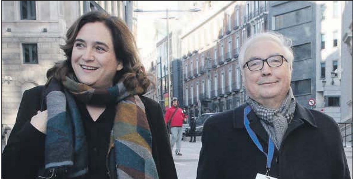
La alcaldesa de Barcelona, Ada Colau, y el ministro de Universidades, Manuel Castells.