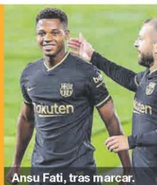
Ansu Fati, tras marcar.