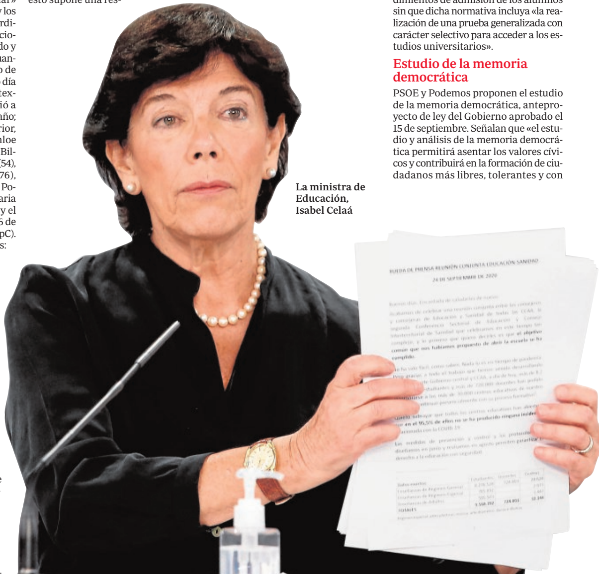
La ministra de Educación, Isabel Celaá

PSOE y Podemos proponen el estudio de la memoria democrática, anteproyecto de ley del Gobierno aprobado el 15 de septiembre. Señalan que «el estudio y análisis de la memoria democrática permitirá asentar los valores cívicos y contribuirá en la formación de ciudadanos más libres, tolerantes y con