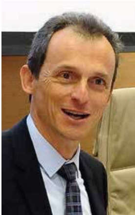
Pedro Duque, ministro de Ciencia e Innovación.