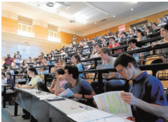
Alumnos de Odontología en la Universidad Complutense de Madrid

CRUE «Lo último que necesita en este momento la universidad son decisiones precipitadas»