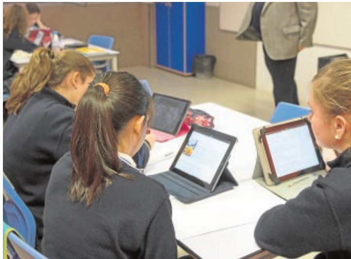
El proyecto pretende impulsar la digitalización en las aulas DE SAN BERNARDO

sentido crítico. El estudio de la memoria democrática deberá plantearse desde una perspectiva de género».