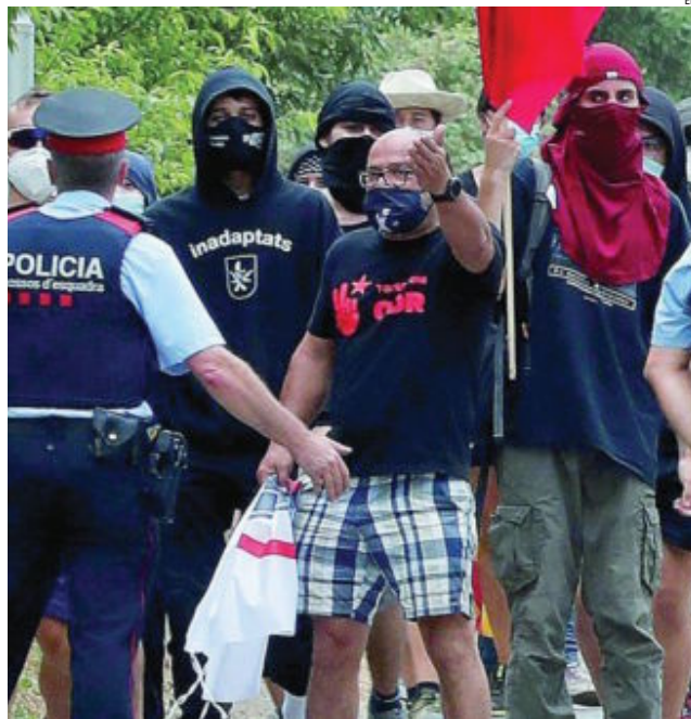
Los Reyes en su visita al Monasterio de Poblet, en Tarragona, en cuyos alrededores se manifestaron grupos de independentistas