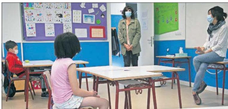
Colegio Público San Sebastián, en El Boalo, el pasado junio.