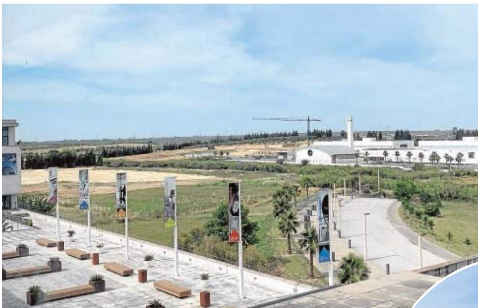
Sobre estas líneas, instalaciones de San Pablo CEU en Bormujos y a la derecha los terrenos donde se realizarán las obras de ampliación y modernización