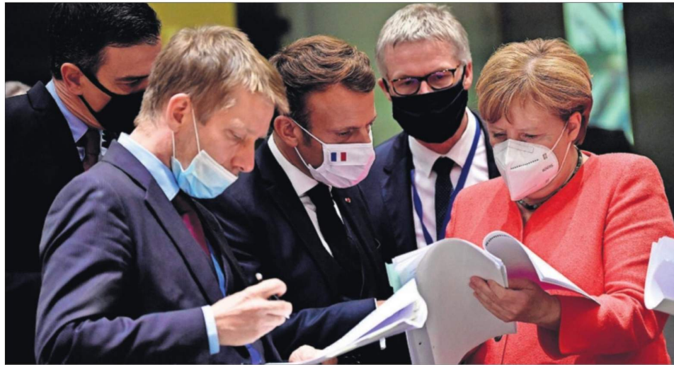
El presidente español, Pedro Sánchez (izquierda); el presidente francés, Emmanuel Macron (en el centro); y la canciller alemana, Angela Merkel (derecha), repasan los documentos del fondo de recuperación que se debate en la cumbre europea de Bruselas.

CULTURA Paseo por la Barcelona en la que Marsé construyó su mundo P28 y 29