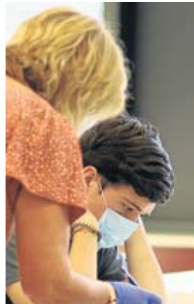
▶ Apoyo. Una profesora, con guantes, resuelve las dudas a uno de los estudiantes que se presentó al examen en Bilbao.

La convocatoria extraordinaria de Selectividad reunió ayer en las sedes de la Universidad del País Vasco de los tres territorios a 900 alumnos de Bachillerato y FP. Entre ellos están los 300 estudiantes que suspendieron la primera cita a la que se presentaron cerca de 11.700, los que no pudieron acudir a los exámenes ordinarios de la primera semana de julio porque tenían alguna materia pendiente de Bachiller y algunos jóvenes vocacionales que quieren subir nota y poder conseguir una plaza en