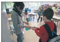
C.P. San Sebastián. / S. B.

Se desconoce el presupuesto, pero el consejero, Enrique Ossorio, ya advirtió que será muy restrictivo. "A estas alturas de año no es posible cifrar el del año que viene", se limita a responder. UGT considera "completamente imposible adecuar los centros sin más dinero". Todos preguntan por el destino de los 290 millones extra del Gobierno central. "Irá a la adquisición de dispositivos, obras, limpieza, mejora de EducaMadrid, formación en nuevas tecnologías, convenios con ayuntamientos, contratación del profesorado y el plan de refuerzo", indica la conse-