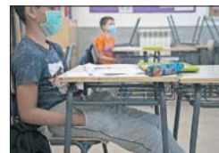
C.P. San Sebastián. / S. B.

puestos de trabajo compartidos cada vez que se usen. "Cada centro requeriría un zafarrancho permanente. Si no se doblan los contratos actuales, no podemos", dicen. "La Comunidad ya ha comenzado con los cambios de los contratos de los institutos y ha comunicado a los ayunta-