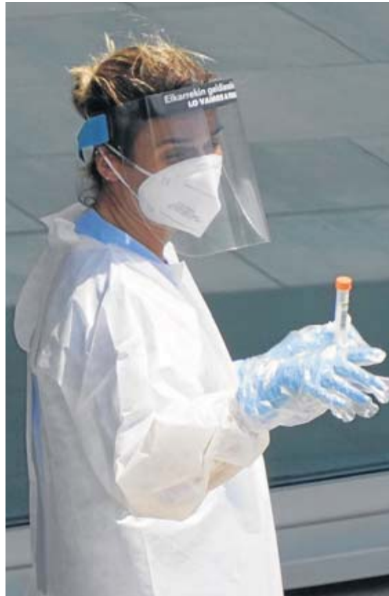
Una enfermera recoge una muestra en un tubo.

Pero aún hay más. El ensayo ha demostrado que nada menos que el 90% de los pacientes tratados con el prototipo de vacuna logró desarrollar anticuerpos neutralizadores tras inyectarles una