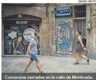
Comercios cerrados en la calle de Montcada.