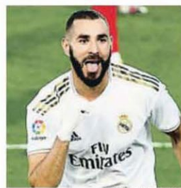
Benzema celebra un gol

EN BARCELONA La crisis de la Covid-19 dispara la cifra de personas sin hogar