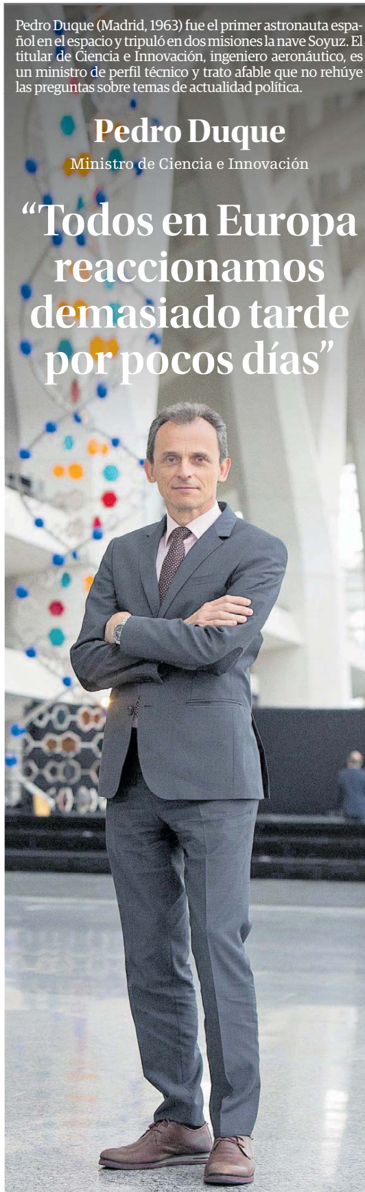
Pedro Duque.

“Todos en Europa reaccionamos demasiado tarde por pocos días”