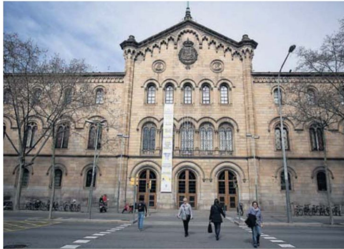
Edificio histórico de la Universidad de Barcelona.

La infrafinanciación de las universidades públicas catalanas, persistente desde hace años, ha supuesto, entre otros efectos, la precarización del profesorado que debería estar haciendo carrera académica. Este profesorado tiene unas condiciones que convierten la estabilidad y el milenarismo en un sueño. También ha tenido graves efectos en el personal de administración y