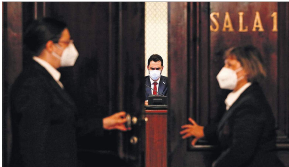
Roger Torrent, ayer en el Parlament tras realizar una declaración institucional sobre el supuesto espionaje.