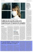
California de nuevo ante la reapertura por el riesgo de contagio El gobernador Gavin Newsom anunció el lunes que California se prepara para reabrir sus escuelas y negocios a principios de agosto, pero con la condición de que los estudiantes y trabajadores lleven mascarillas.