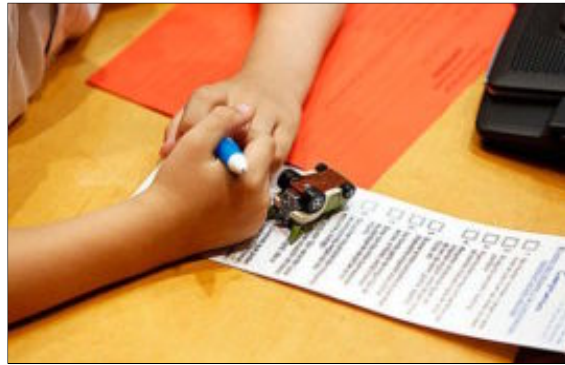
Un niño participa en una acción frente al acoso escolar.

Según el consejero de Educación de Madrid, Enrique Ossorio, las cifras son buenas, pero no suficientes. «Tenemos que conseguir que haya cero alumnos acosados», indicó du-