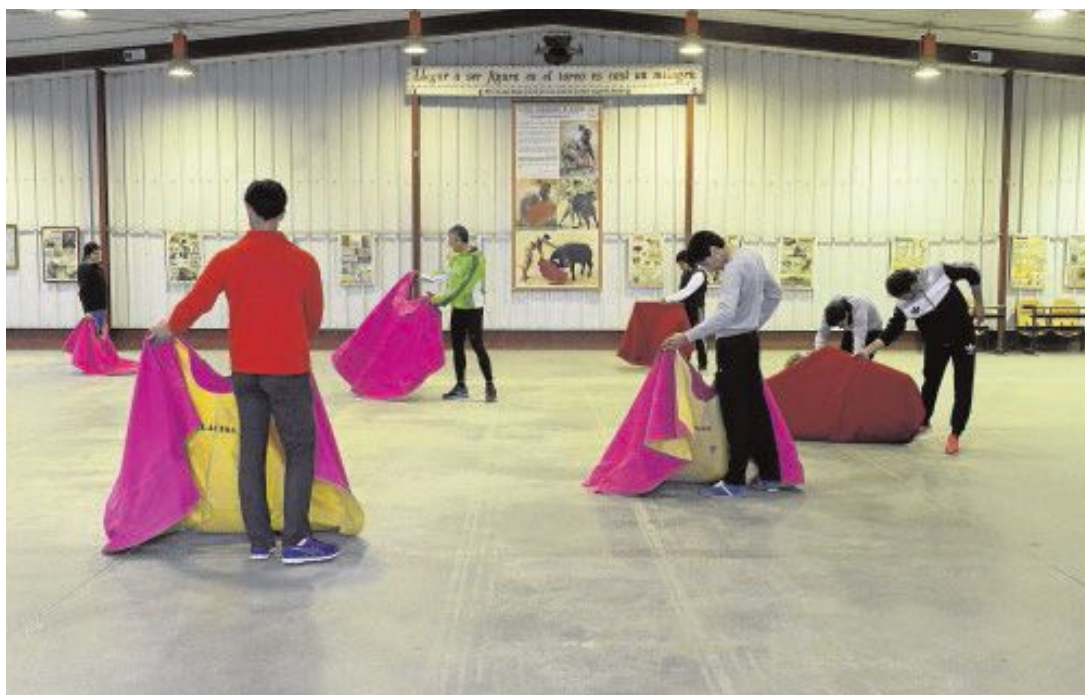
Los alumnos practican con el capote y la muleta en la escuela Marcial Lalanda, en la Venta del Batán MAYA BALANYA