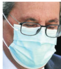
El presidente catalán, Quim Torra

La Generalitat aprobó la noche del lunes al martes un decreto de modificación de la ley de salud pública elaborado en apenas un puñado de horas para sortear el freno judicial al confinamiento de Lérida y siete poblaciones más del Segrià. Un «nuevo marco jurídico», como señalan desde el Ejecutivo catalán, para burlar al juez y endurecer las restricciones causa de los rebotes sin necesidad de pedir la aplicación del estado de alarma. La normativa, además, cuenta con el benepláci-