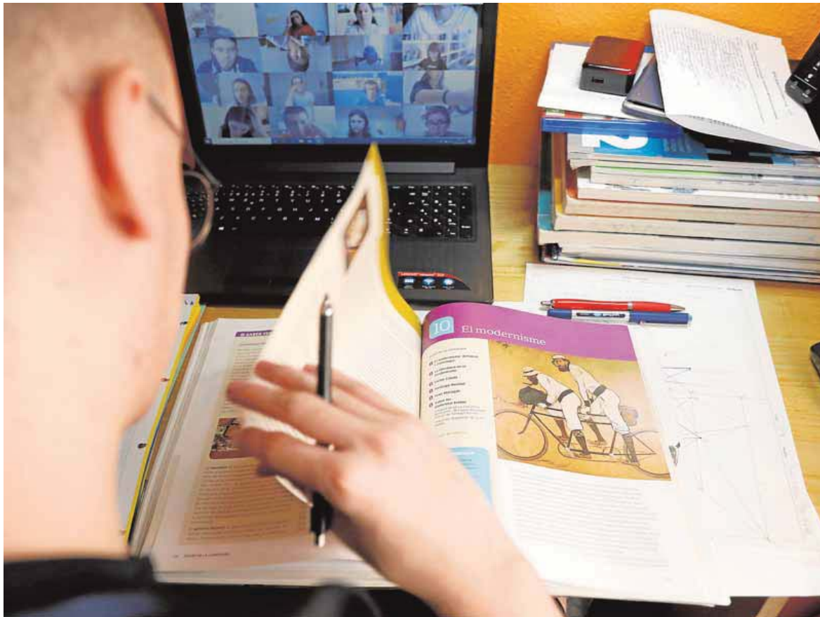
Un alumno asiste a una clase online desde su casa. LP