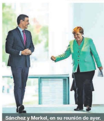
Sánchez y Merkel, en su reunión de ayer.

Salut pide a tres barrios de L'Hospitalet que se queden en casa