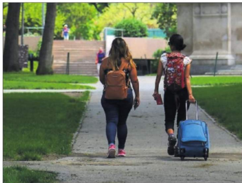
Dos estudiantes en la Universidad de Harvard, el 8 de julio.

La primera de las denuncias se dirimió ayer en un juzgado de Boston. Las universidades pedían que se suspendiera la aplicación de la orden de forma cautelar. El caso se ha cerrado con el desistimiento del Gobierno. La juez, Allison Burroughs, dijo expresamente que el acuerdo es de aplicación en todo el país.