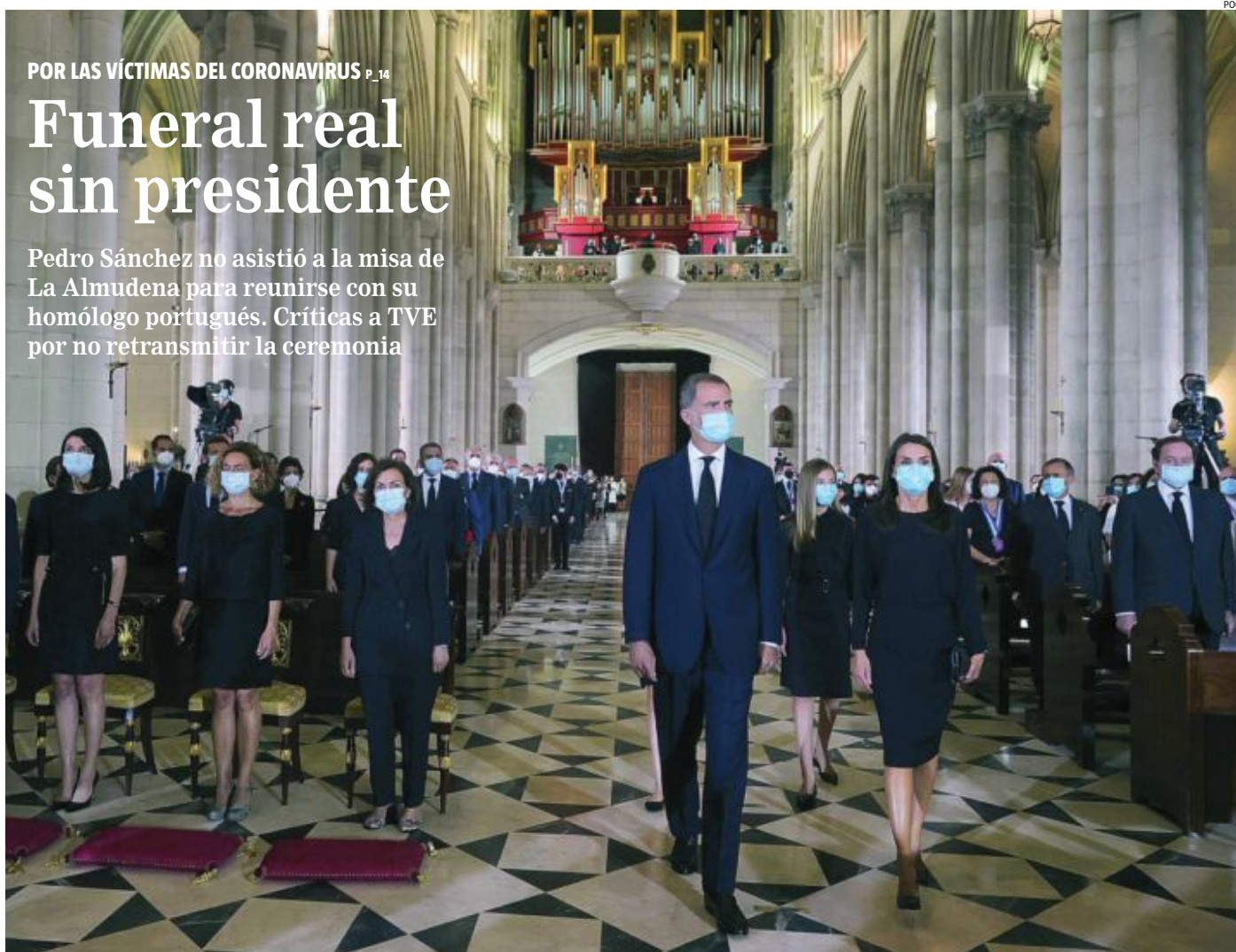
Los Reyes Felipe y Letizia, acompañados de la Princesa Leonor y la Infanta Sofía (detrás de ambos) a su llegada a la catedral de La Almudena en Madrid para presidir la misa funeral por las víctimas de la Covid-19

Pedro Sánchez no asistió a la misa de La Almudena para reunirse con su homólogo portugués. Críticas a TVE por no retransmitir la ceremonia