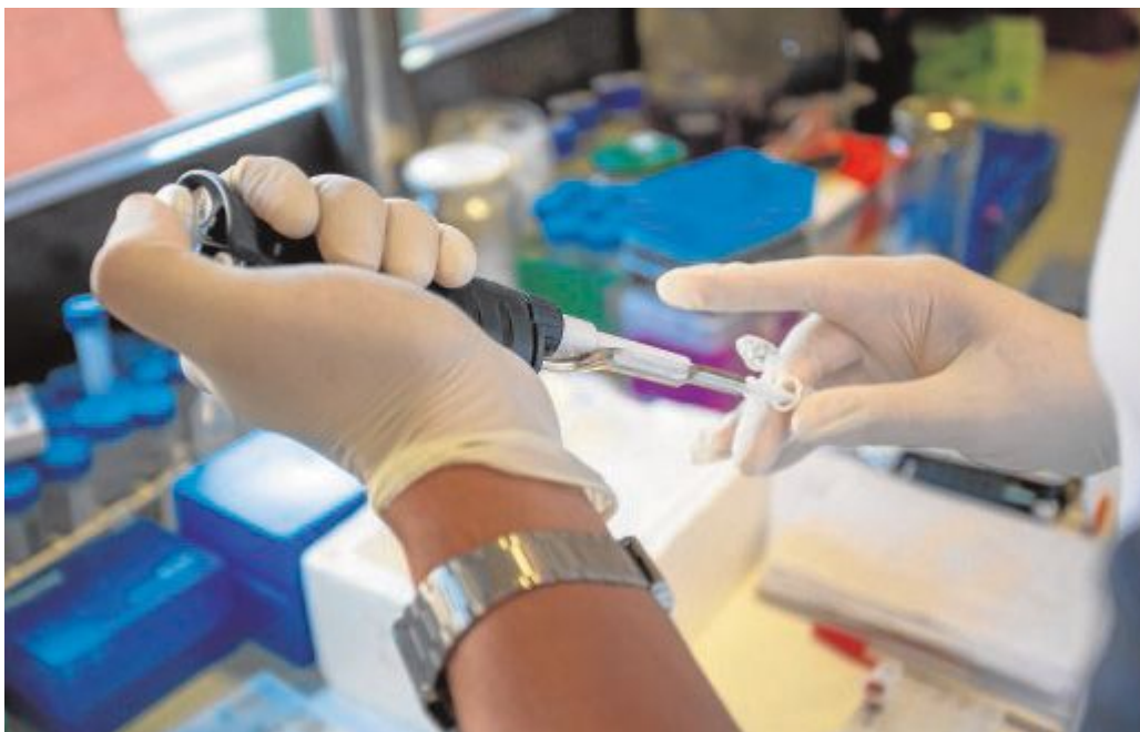
Una prueba de investigación en un laboratorio

Finalmente, la última línea de apoyo de la Junta a la investigación en la comunidad autónoma busca proyectos singulares en los sistemas que ya se están trabajando en los Campus de Excelencia Internacional y que contarán con seis millones de euros. Son ayudas que pretenden financiar acciones concretas de transferencia del conocimiento. Todas estas actuaciones se enmarca en el eje estratégico del Plan Andaluz de Desarrollo e Innovación (PAIDI) previsto para este ejercicio 2020 y con fondos que el presupuesto de este año asignaba al mismo.