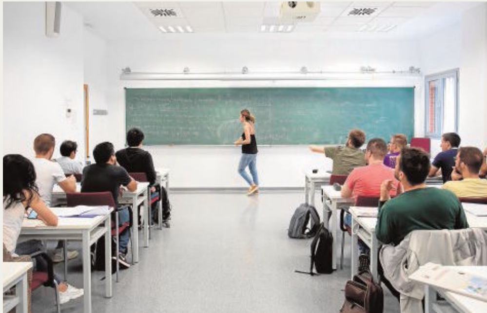
Sobre estas líneas, el Instituto de Matemáticas de la Universidad de Sevilla, IMUS