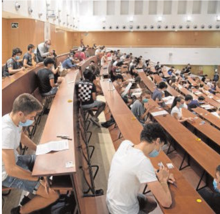
Estudiantes de Madrid en una de las aulas de la Complutense

Atravesar la puerta principal fue la parte más complicada; después, los alumnos, que lucían una pulsera de color (azul, roja, amarilla o verde), debían seguir las señalizaciones en el suelo hasta su ubicación previamente