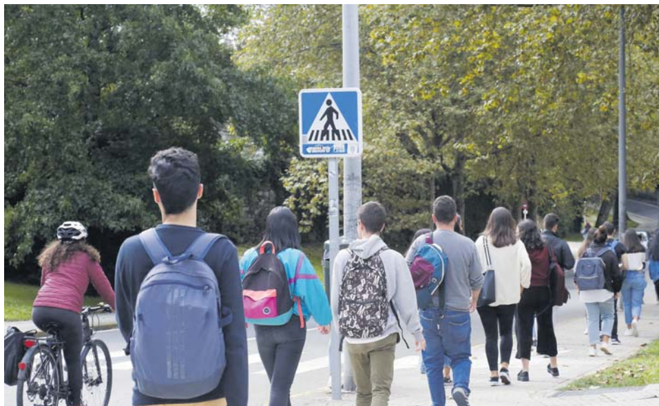
CAMPUS NORTE (USC). Varios estudiantes se dirigen hacia sus hogares tras salir de clase.

Las tres universidades gallegas deberán remitir a la Xunta sus “planes de contingencia” para cada centro antes del 31 de julio