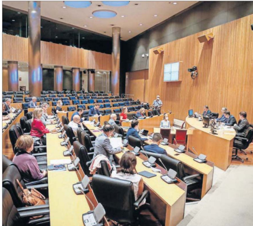
Sesión de la Comisión para la Reconstrucción Social y Económica del Congreso, en junio.

“¿Por qué quieren dejar atrás a uno de cada cuatro niños?”, pregunta el PP