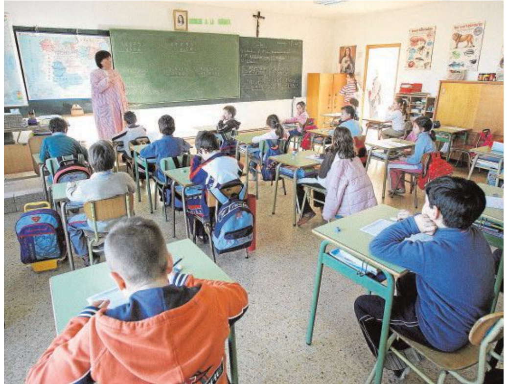
Alumnos tienen clase en el aula de un colegio católico

PP, Cs, Coalición Canaria y hasta Junts per Cat presentaron enmiendas en defensa de la concertada (los catalanes, algo tibias y más relacionadas con cuestiones competenciales), aunque no salieron adelante. La diputada del PP, Rosa