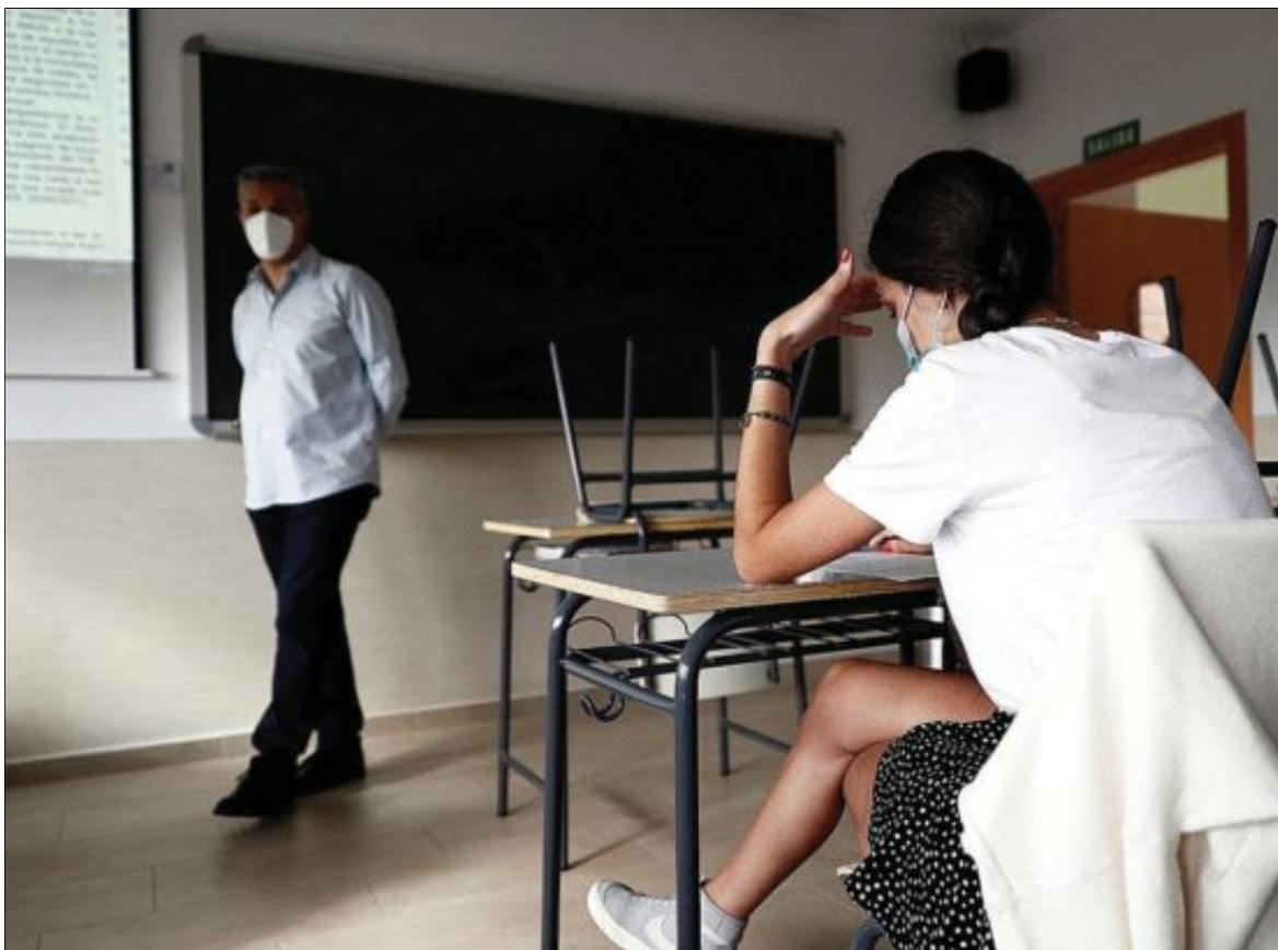
Una alumna de 2º de Bachillerato asiste a clases de repaso para prepararse para la Selectividad en el instituto Simone Veil de Paracuellos del Jarama (Madrid).