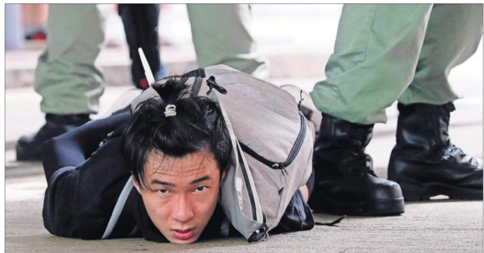
CENTENARES DE DETENCIONES ESTRENAN LA NUEVA LEY CHINA PARA HONG KONG. La entrada en vigor de la Ley de Seguridad Nacional con la que Pekín estrecha su control sobre la antigua colonia británica se vivió en la ciudad con manifestaciones de protesta pese a ser prohibidas, cargas policiales y al menos 300 detenciones, como la que muestra la imagen. PÁGINAS 4 Y 5

adelante en la votación final de hoy. Ciudadanos fue más lejoso y acordó también las conclusiones de la mesa para la reconstrucción económica, una de las cuatro en que se han dividido los trabajos. El consenso no fue posible en la que trata de políticas sociales por la propuesta de la izquierda que excluye a la escuela concertada de futuras ayudas. PÁGINAS 16 Y 24