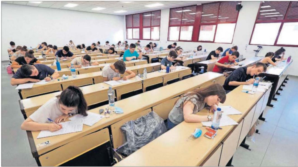
Alumnos durante los exámenes de Evaluación del Bachillerato para el Acceso a la Universidad (EBAU), ayer en Valladolid.

Los campus y sus especialistas lideran el proceso para diseñar y organizar unas pruebas nacidas hace 45 años y que siempre han estado en cuestión