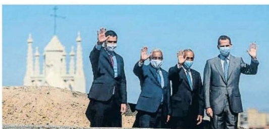
Pedro Sánchez, António Costa, Marcelo Rebelo de Sousa y Felipe VI