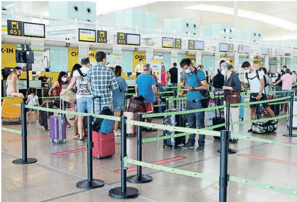
ALEX RECOLONS / ACP

PAÍSES FUERA DE LA UE Italia, Austria y Bélgica imponen más restricciones INTERNACIONAL / P. 6