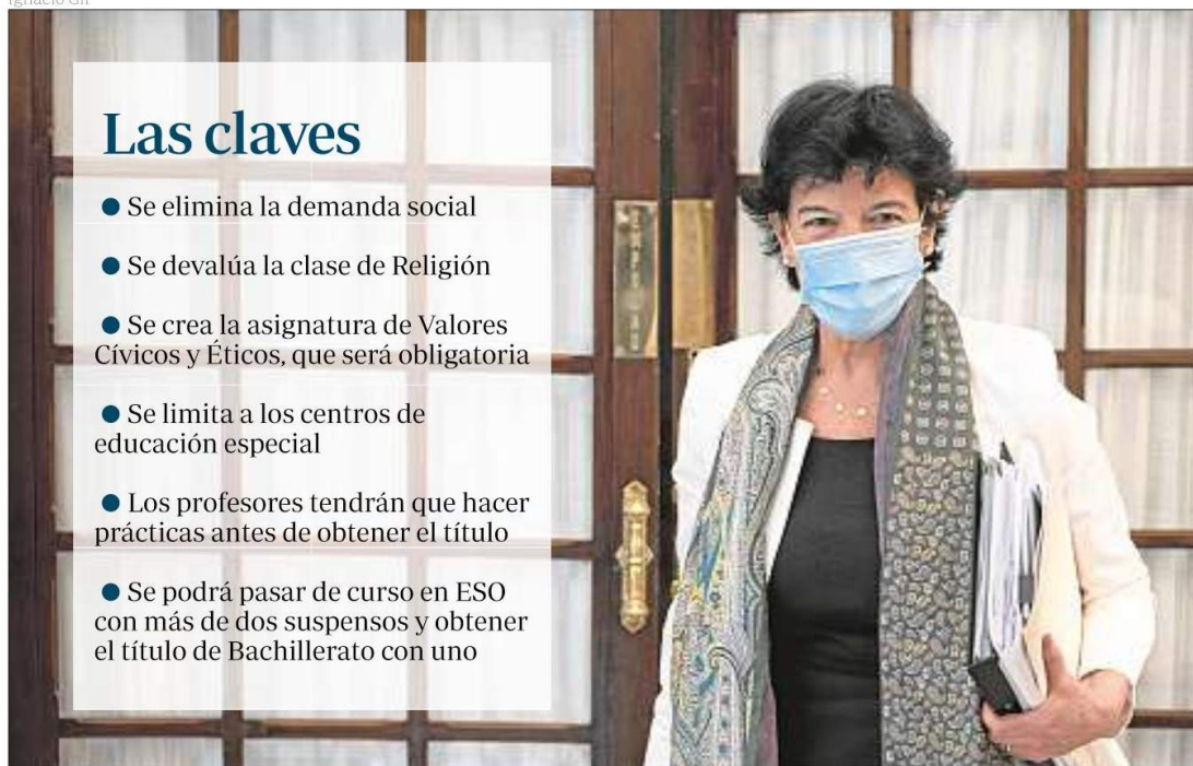
La ministra de Educación, Isabel Celaá, en el pleno de control al Gobierno en el Congreso de los Diputados, el 17 de junio

con una doble opción: una que incluiría las enseñanzas religiosas específicas confesionales y otra que se elaboraría desde una laicidad positiva, «la que corresponde a un Estado moderno».