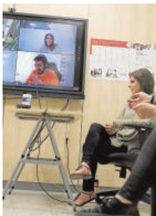
Clase por videoconferencia EP

Espero sinceramente que, si la situación sanitaria general lo permite, ninguno de los agentes sociales vaya a poner límites, reivindicaciones o exigencias que puedan dificultar que el cuerpo de docentes de nuestro país dé el paso adelante que la sociedad espera de ellos y podamos ser uno de los colectivos protagonistas de la recuperación económica y social de nuestro país.