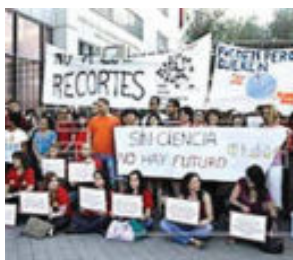
Manifestación científica en 2013.

Los promotores de la protesta también entregaron ayer a la Comisión de Reconstrucción del Congreso un manifiesto, promovido junto a la asociación Scientist Dating Forum. En el documento, al que se sumaron 25 entidades científicas y de otros