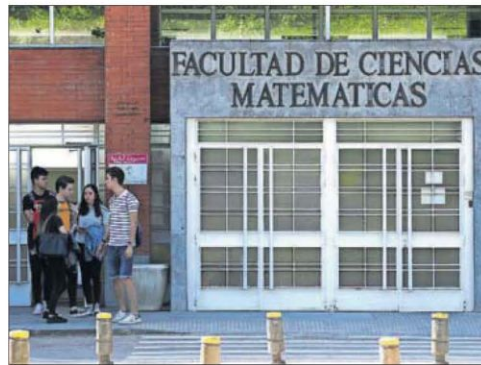
La Facultad de Matemáticas de la Complutense, en Madrid.

La Pompeu Fabra aspira a que, como en los países anglosajones, un alumno entre en primero y, con la ayuda de un tutor, diseñe todo su itinerario formativo hasta lograr el grado acorde a sus intereses y capacidades. Pero hoy la rígida estructura del sistema universitario español lo impide. Al menos, la Pompeu Fabra —igual que la Carlos III de Madrid, con la que está hermanada en proyectos— ha logrado ofrecer grados abiertos que permiten al alumno en los primeros dos cursos escoger materias de cualquier carrera