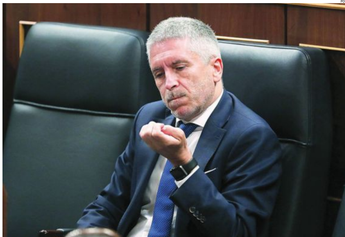
DESPRECIO EN EL CONGRESO. Marlaska se ausentó ayer durante el debate de su reprobación, que no saldrá adelante gracias a los votos de Podemos y PNV

DE LAS DIECIOCHO GRANDES ECONOMÍAS NUESTRO PAÍS ES EL QUE MÁS CAE POR LA CRISIS DE LA COVID