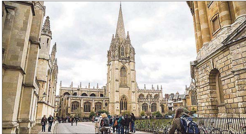
Sede de la Universidad de Oxford. EE

El tratamiento es la dexametasona, un medicamento antiguo y de fácil producción, lo que le convierte en un candidato ideal por su accesibilidad, precio y contrastado perfil de seguridad. El equipo investi-