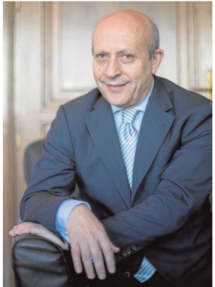
El exministro de Educación José Ignacio Wert

—Lo más grave de todo es que lo que dice es mentira. El rigor conceptual en el uso del castellano de la señora Celaá no es particularmente notable. Hay una obsesión por criticar sin base objetiva y estaría encantado de discutir punto por punto con ella estas imputaciones falsas que se hacen a la Lomce. El hecho de que se centre tanto en ella no deja de ser una especie de lapsus freudiano: «Yo necesito justificar esto de alguna forma porque solo no se justifica, así que vamos a echar basura a ver si cuela». Por otro lado, quiero recordar que todas las métricas relevantes que tienen que ver con acceso y resultados,