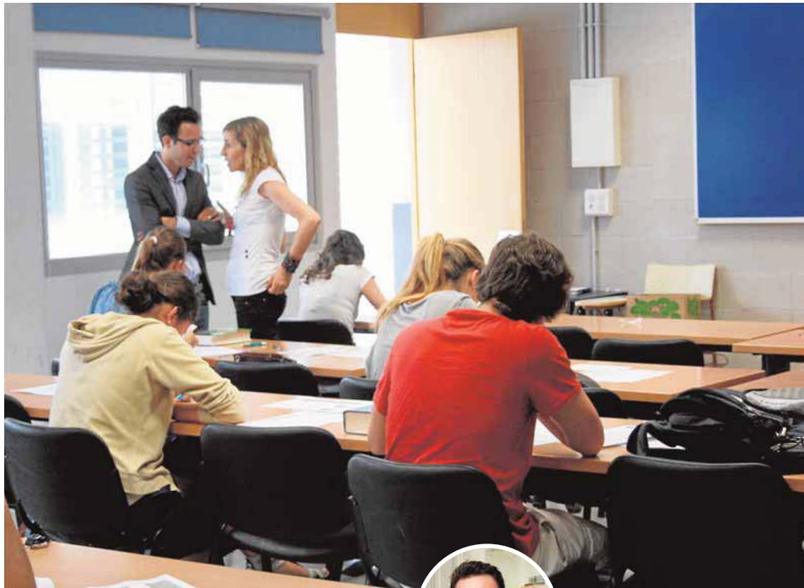
◀ Aula específica de apoyo en una sesión anterior de la PAU en Baleares.