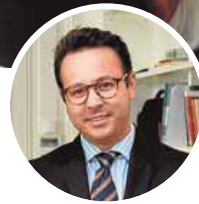
▶ El secretario general de la federación de Dislexia.

Dislexia. La federación nacional pide que no penalicen sus faltas de ortografía y que les lean las preguntas. La Comunitat no lo hace y el Síndic y el Defensor del Pueblo ya lo investigan