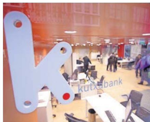
El banco cubre con renovables su consumo de energía.

Como este equilibrio se sustenta en recursos propios, la masa arbórea que tiene en Álava, Bizkaia y Gipuzkoa, la entidad no tiene que recurrir al mercado para la compra de "créditos de carbono".