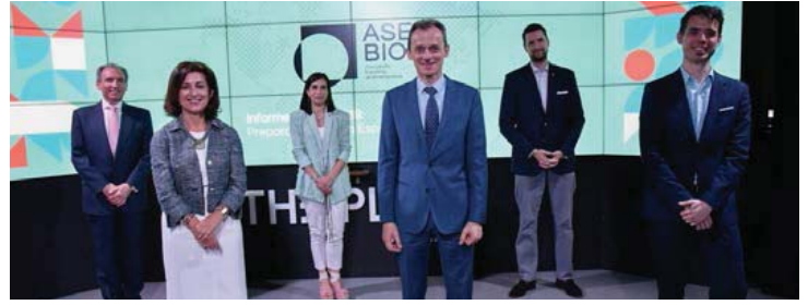
Asebio sitúa a España como la novena potencia en producción científica en biotecnología

De acuerdo a los datos anteriores, las empresas biotech se situaron en 2018 en la primera posición, unas cifras que sitúan por primera vez al sector biotecnológico por delante del sector farmacéutico. En este sentido, el ministro