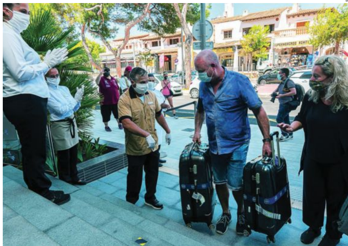
Llegada de los primeros turistas alemanes al Hotel Riu Concordia de Palma ayer, dentro del plan piloto para la visita de turistas extranjeros a las islas Baleares