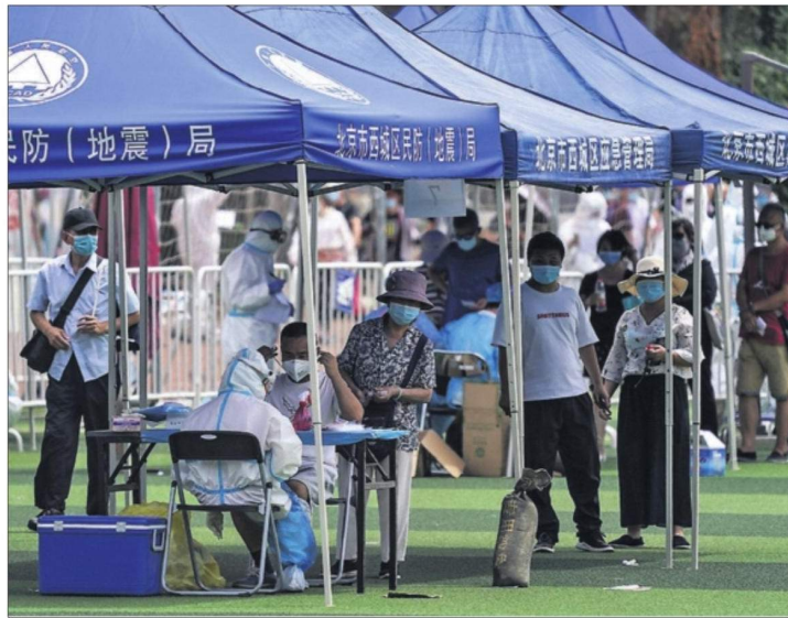
TEST MASIVOS ANTE EL REBROTE EN CHINA. Miles de vecinos de Pekín que visitaron el mercado de Xinfadi o viven en la zona donde se detectó un repunte de casos de covid-19, con al menos 79 contagios en cuatro días, fueron llamados ayer a realizarse test y a permanecer confinados. / EFE PÁGINA 25

DANI CORDERO, Barcelona El Gobierno dará ayudas de entre 400 y 4.000 euros a la compra de un coche nuevo, cifra que deberá ser igualada por fabricantes y concesionarios. La cuantía dependerá de las emisiones, de forma que alcanzará el máximo para los vehículos etiquetados como cero, y exigirán la entrega para desguace de un automóvil con más de 10 años. Pedro Sánchez presentó ayer el plan, dotado con 350 millones de euros, con el que se intenta incentivar la renovación del parque y sacar a la industria del duro impacto de la pandemia. PÁGINA 38