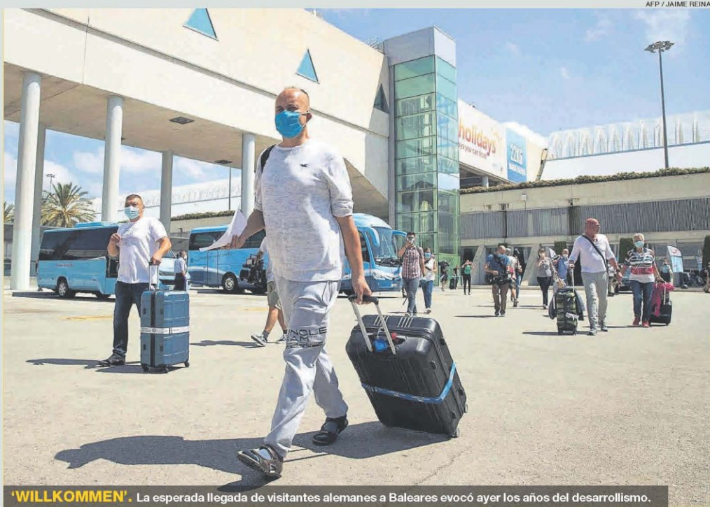
'WILLKOMMEN'. La esperada llegada de visitantes alemanes a Baleares evocó ayer los años del desarrollismo.

La patronal ve escaso el plan de Trabajo de alargar los ertes hasta el 30 de septiembre