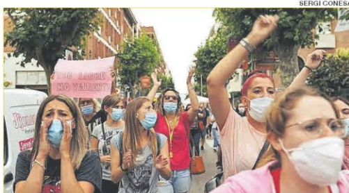
Marcha para exigir más seguridad en Premià de Mar, ayer.

Crisis de convivencia y de seguridad en Premià ► 28 y 29