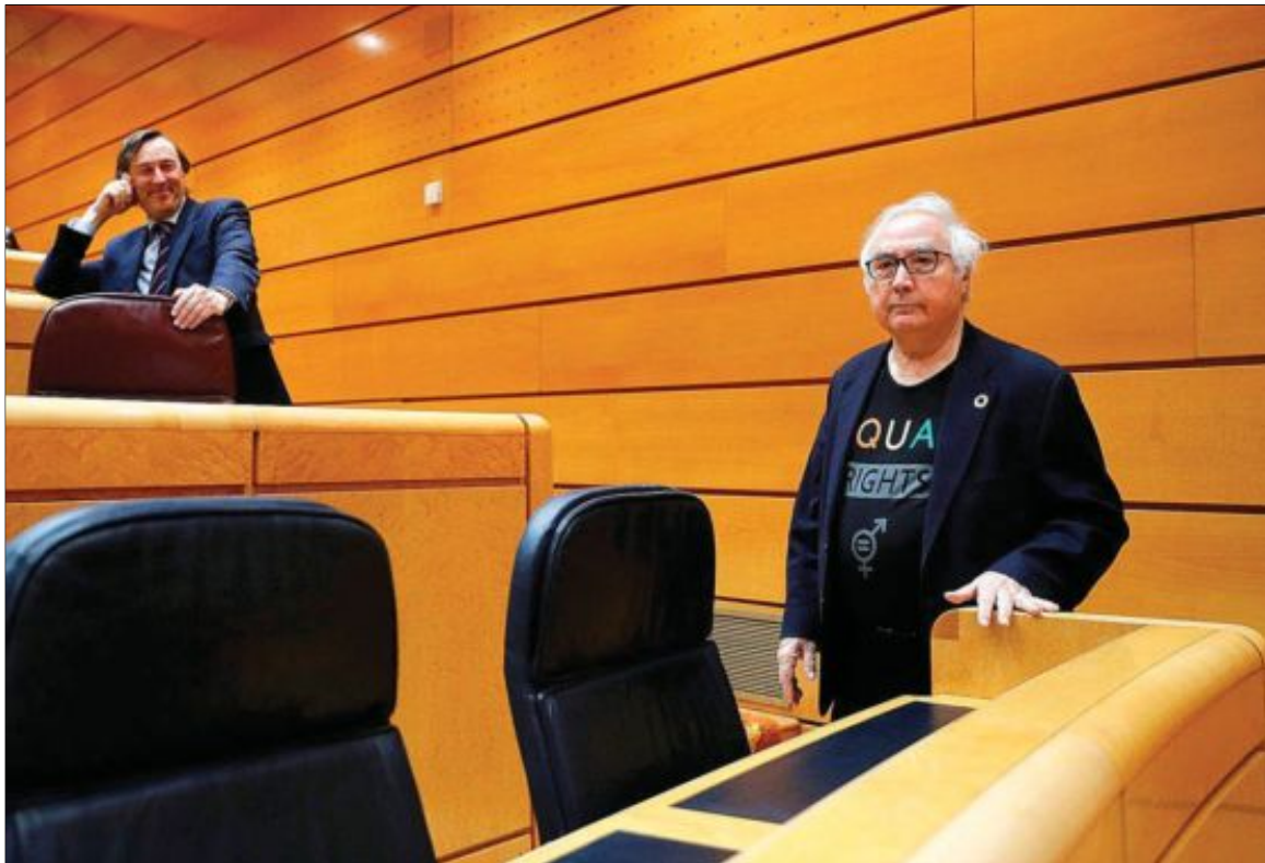
El ministro de Universidades, Manuel Castells, junto al senador del PP Rafael Hernando, en el Pleno de la Cámara Alta.