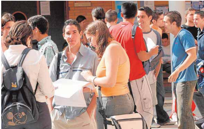
Alumnos de la UMA, en una imagen de archivo. sur