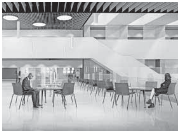
Recreación de nuevos espacios en el hall del edificio Amigos de la UN. DN

Para proteger la salud de las personas, el centro universitario ha decidido reducir a la mitad el aforo de las aulas. Para no perder capacidad, ha duplicado los actuales espacios de trabajo mediante la creación de nuevas zonas, distribuidas en tres grupos: lugares de estudio personal y en silencio, lugares de trabajo presencial en grupo con distancia de metro y medio entre personas, y lugares de trabajo con conexión en remoto. En total, se podrían habilitar casi 2.000 espacios de trabajo si fuera necesario. “Con estas zonas queremos