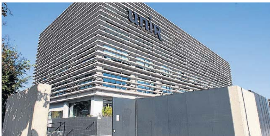
Fachada del edificio de la UNIR.