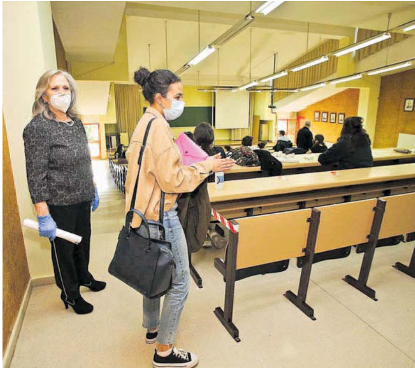
Una alumna se desinfecta las manos antes de entrar al examen de Matemáticas de primero de Química, uno de los primeros presenciales celebrados en la Universidad de Oviedo.