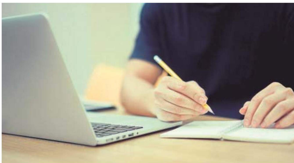
Los problemas de conexión causan ansiedad y estrés a la hora de hacer los exámenes