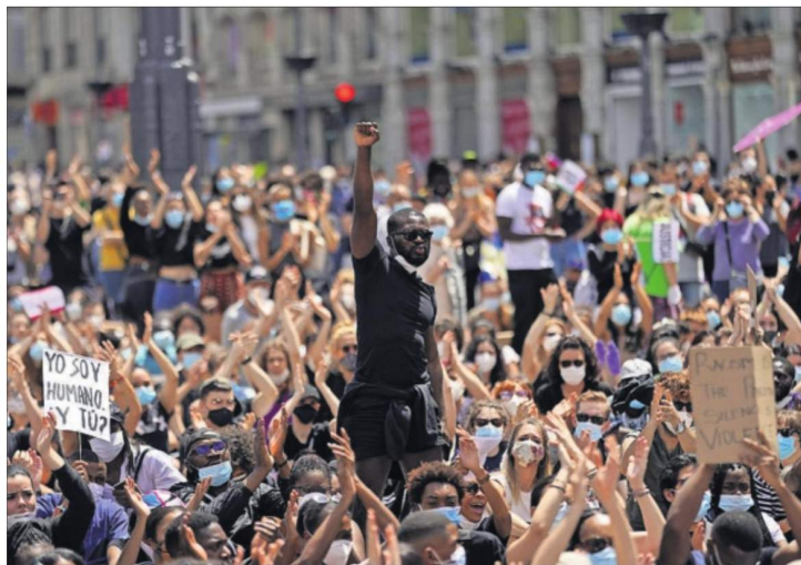
UN GRITO CONTRA LA XENOFOBIA EN MADRID. Miles de personas marcharon ayer frente a la Embajada de EE UU en Madrid y hasta la Puerta del Sol contra el racismo y la discriminación. Barcelona y San Sebastián fueron otras de las ciudades que registraron manifestaciones. PÁGINA 2

SOCIEDAD El reto de vivir tras pasar dos meses en la UCI P22