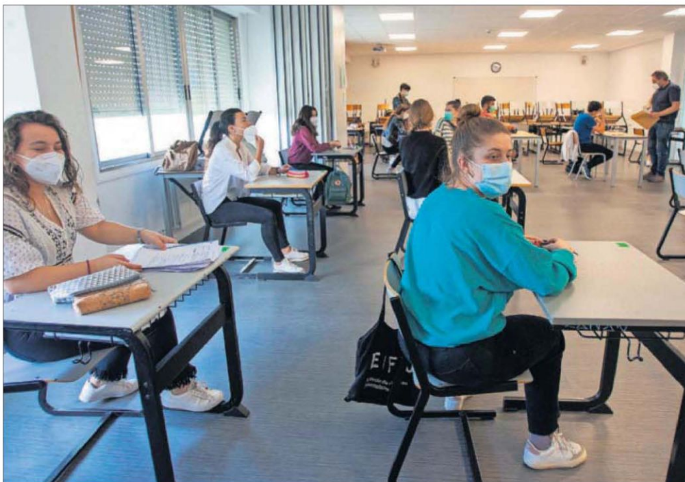
Alumnos, en un examen en el colegio Axular de San Sebastián, el 25 de mayo.

Estas medidas se desarrollarán en futuros decretos de currículo para que la estructura clásica de asignaturas pueda convivir y evolucionar con una mayor globalización curricular