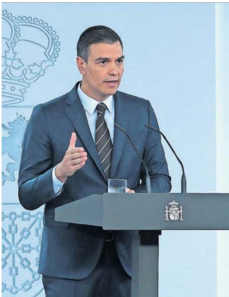
Pedro Sánchez, durante su comparecencia ayer en La Moncloa.

Otros presidentes regionales consultados no comparten los reproches y vinculan la desaparición del fondo social a la puesta en marcha del ingreso mínimo vital. Dotado de 3.000 millones, el 26 de junio lo empezarán a cobrar 255.000 beneficiarios. “Entiendo que los presidentes autonómicos quieren más, más y más. Pero el Gobierno está haciendo una transferencia sin precedentes en la historia de la democracia”, zanjó Sánchez.