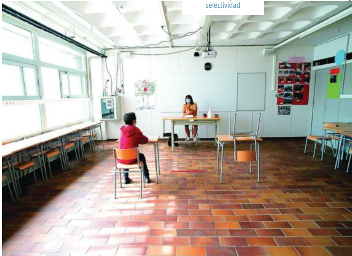
Un alumno en un centro escolar. Autonomías como Madrid organizan desde hoy tutorías para niños que necesitan refuerzo

En Educación Primaria hay mayor consenso autonómico. Todos los alumnos pasan de curso, repetir es algo muy excepcional y todas las Administraciones coinciden en que el último trimestre no puede perjudicar la nota final. En Canarias, la norma autonómica propone que los alumnos pasen de curso «aunque no hayan alcanzado los aprendizajes previstos». En Castilla-La Mancha, se toma como referencia el progreso general del alumno para pasar de curso. Y, si no hay consenso entre los profesores, se votará y valdrá la mayoría simple del equipo docente.