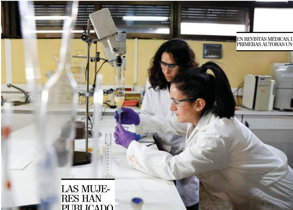
Dos científicas, en el laboratorio del CENIM, en Madrid.

EN REVISTAS MÉDICAS, LAS MUJERES HAN SIDO PRIMERAS AUTORAS UN 23% MENOS QUE EN 2019