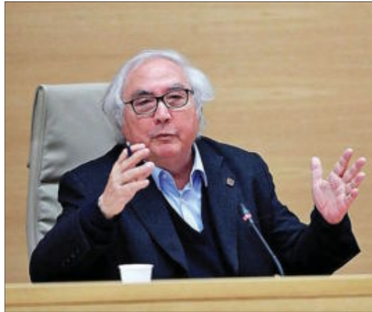
El ministro de Universidades, Manuel Castells.

rido redactar un marco común con medidas concretas para prevenir posibles contagios. Los responsables autonómicos y universitarios sienten que tienen que planificar por su cuenta todos los pormenores de un examen que acarrea riesgos evidentes sin contar con el respaldo del Estado. «Si esto no se gestiona bien puede ser un problema. Los estudiantes tienen 17 o 18 años, muchas ganas de ver a sus amigos y una percepción del peligro bastante leve. Las universidades temen que se produzcan contagios y tengan que enfrentarse a demandas judiciales sin disponer de una cobertura legal que haya avalado sus decisiones», advierten fuentes universitarias de la Comunidad de Madrid. «Queda muy poco tiempo y no hay una definición clara de la organización, no sabemos qué va a