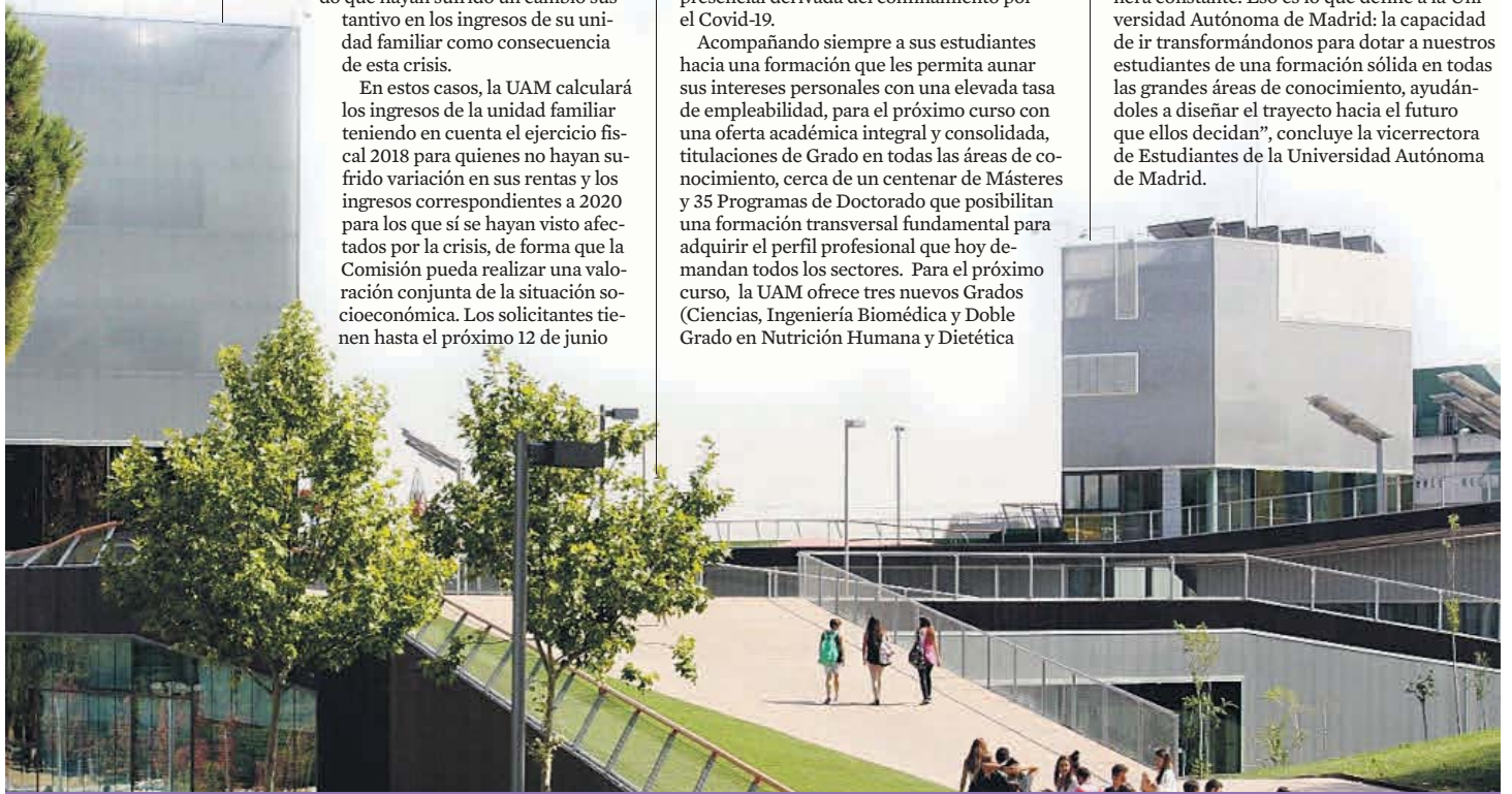
Plaza Mayor de la Universidad Autónoma de Madrid. UAM

Es una potencia en el ámbito investigador, es Campus de Excelencia Internacional