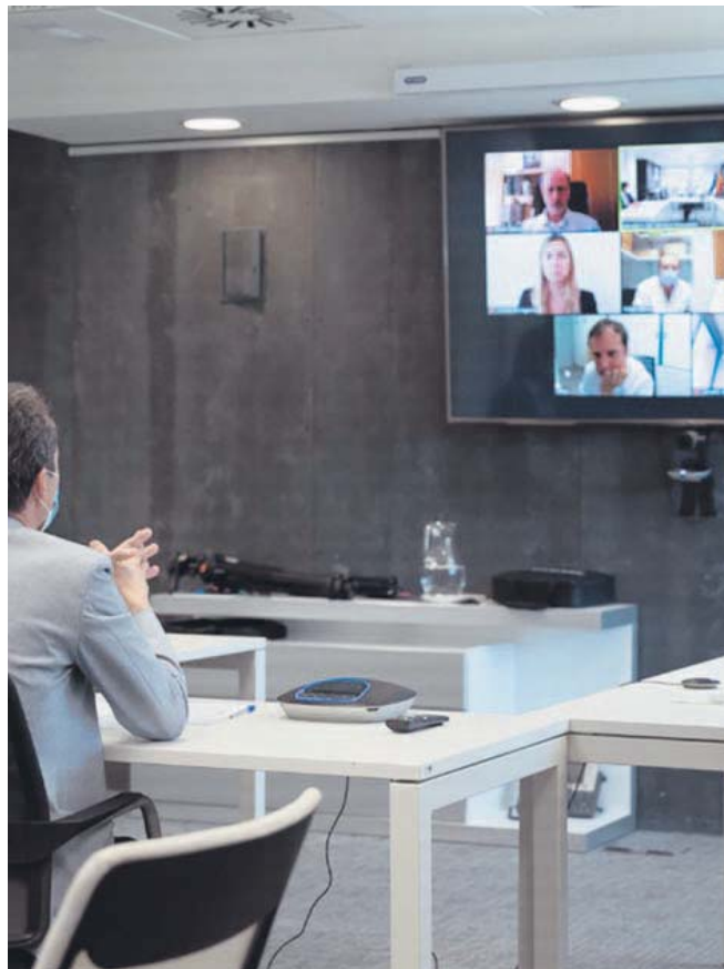
EL MINISTRO SE REUNIÓ CON LOS CIENTÍFICOS POR VIDEOCONFERENCIA.