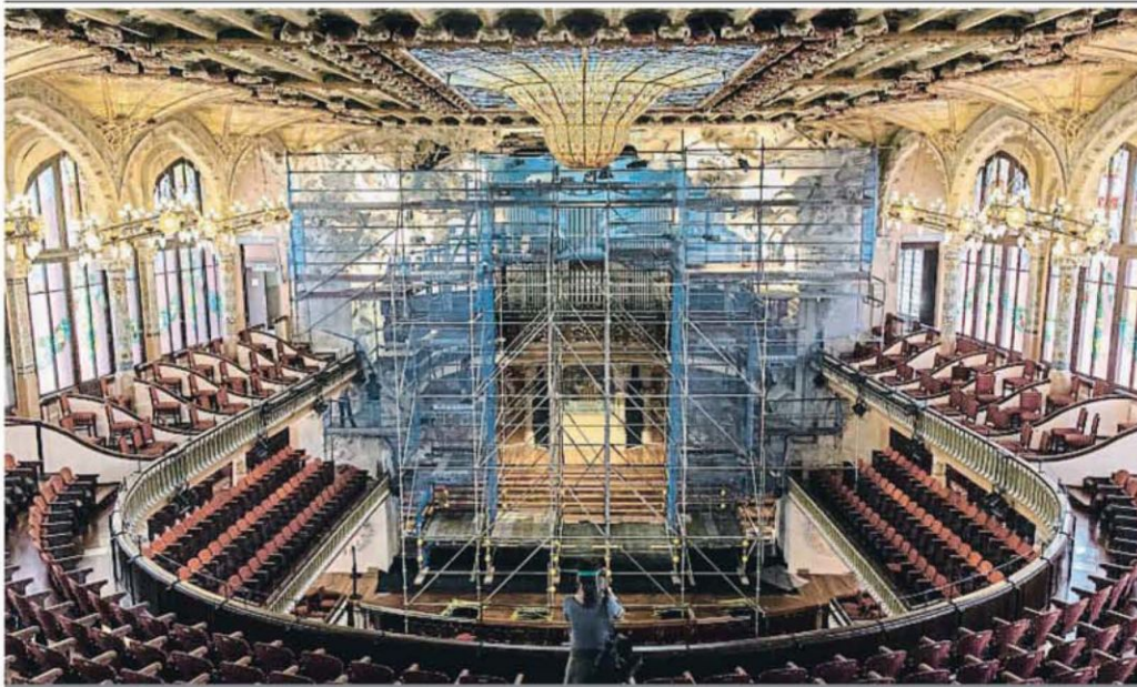
EL PALAU APROVECHA PARA PONERSE A TONO

Los colegios tendrán que reabrir antes del verano si están ubicados en territorios que hayan entrado en la fase 2, aunque la asistencia de los alumnos será voluntaria. Los centros deberán garantizar ratios por clase, distancia física y uso de mascarillas. SOCIEDAD / P. 24