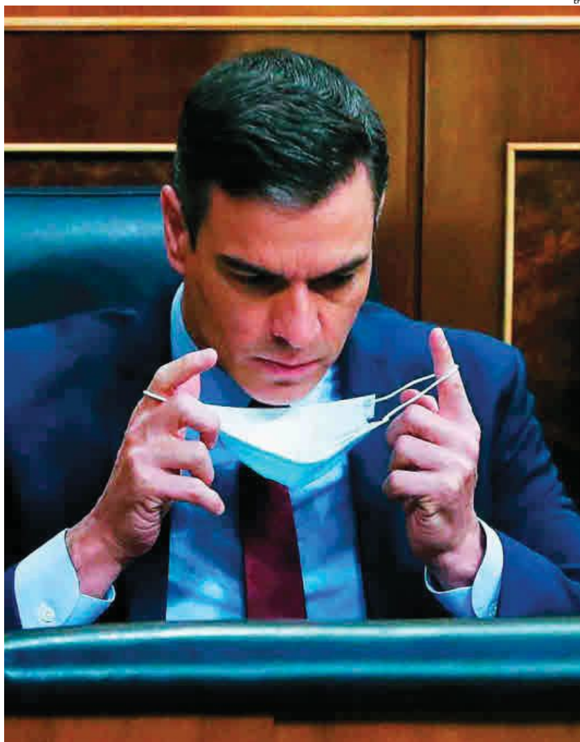
El presidente Sánchez, ayer, con una mascarilla en el Congreso de los Diputados

Demasiada crisis para este Gobierno débil