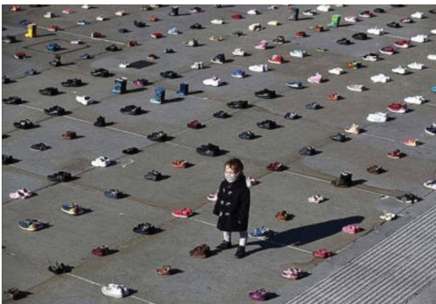
Protesta del grupo ecologista Extinction Rebellion, con 1.500 pares de zapatos infantiles en Londres.