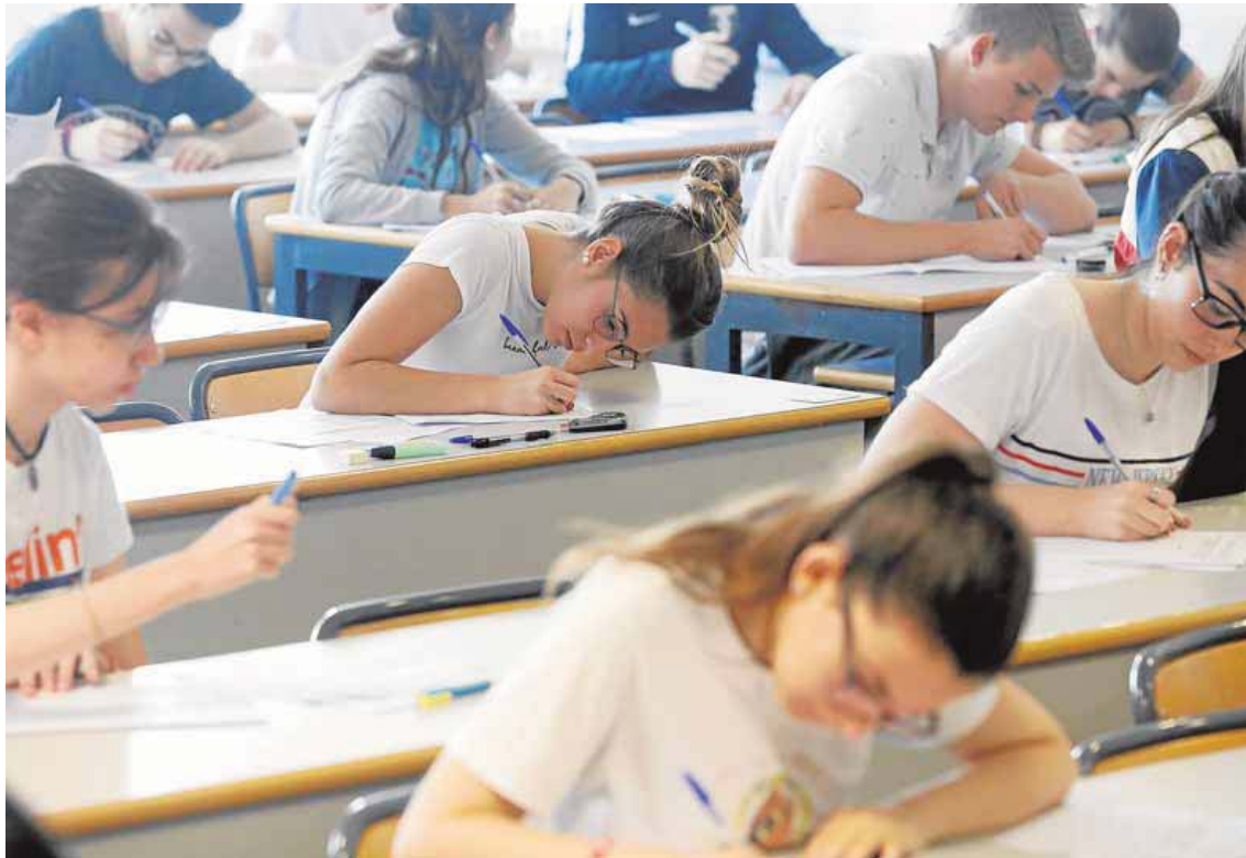
Estudiantes durante la selectividad de 2019. La de este año se organizará en los centros donde ha estudiado el alumnado. IRENE MARSILLA