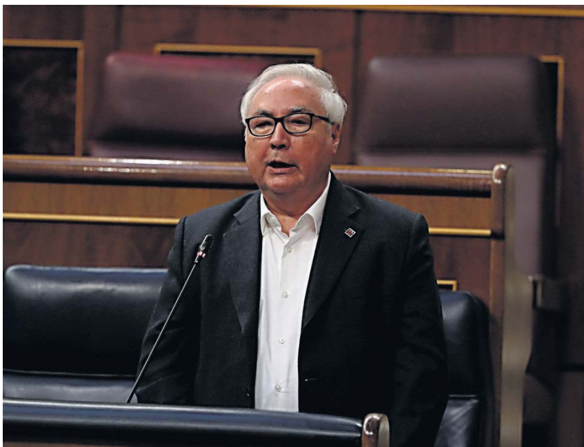
El ministro de Universidades, Manuel Castells, ayer en el Congreso.

Finalmente, señaló que están “elaborando un plan de reforzamiento de la educación on-line en colaboración con la Conferencia de Rectores y las comunidades, de forma que estemos preparados para cualquier contingencia. Se requerirá probablemente un esfuerzo presupuestario para hacerlo posible”.