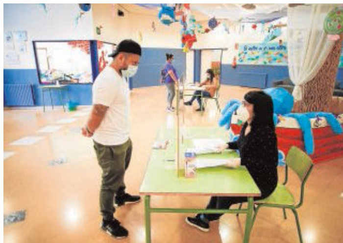
Una administrativa atiende a una persona durante la preinscripción escolar

Menos alumnos La ratio de alumnos oscilará entre los 5 de infantil a los 15 en los institutos de Secundaria