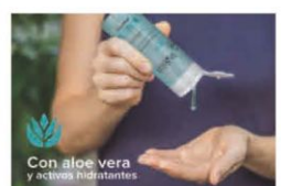
Con aloe vera y activos hidratantes

IMPULSO AL 'STREAMING' La pandemia revolucionará la producción y el consumo de cine ► 40 y 41