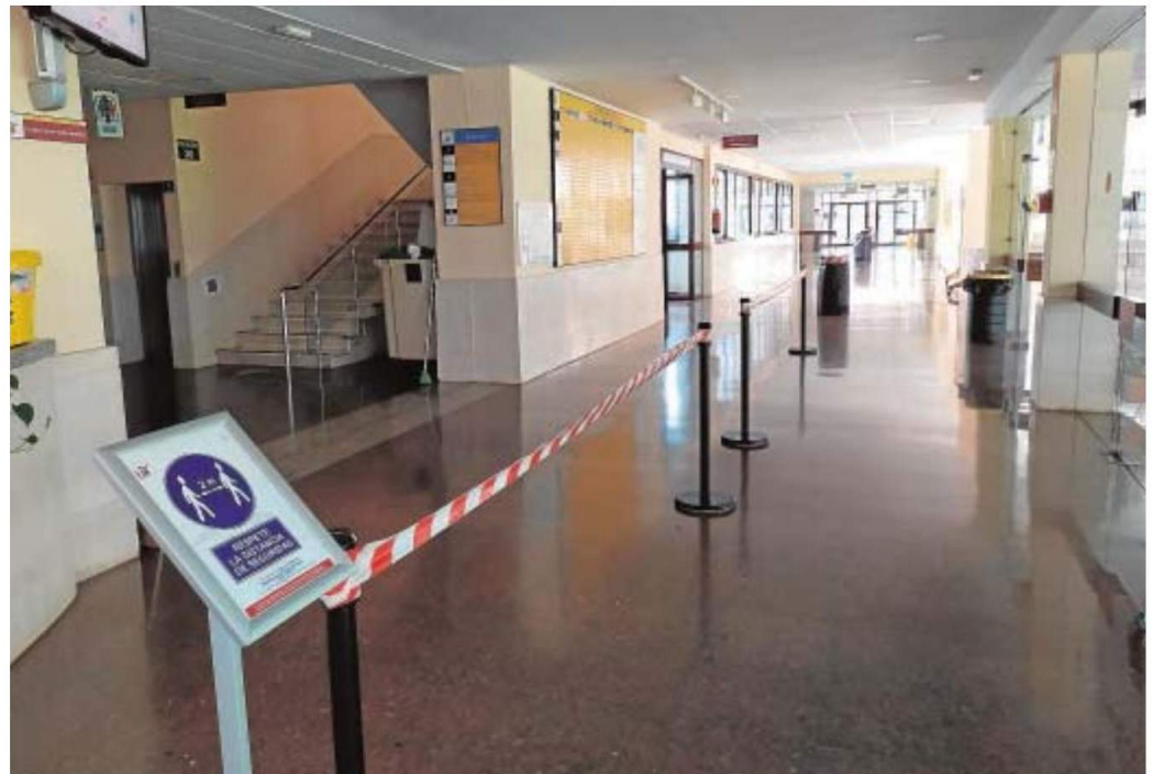
La nueva señalización en la Escuela Técnica Superior de Informática

En lo que respecta a los salones de grado se limitará el aforo para guardar las distancias y las máquinas vending deberán desinfectarse y limpiarse mientras que las cafeterías y comedores permanecerán cerrados hasta que lo indiquen la autoridades sanitarias.