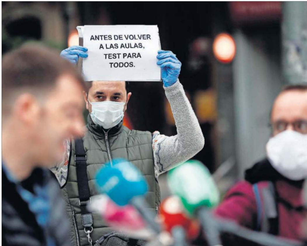
Concentración ayer en Pamplona contra el regreso a las aulas.