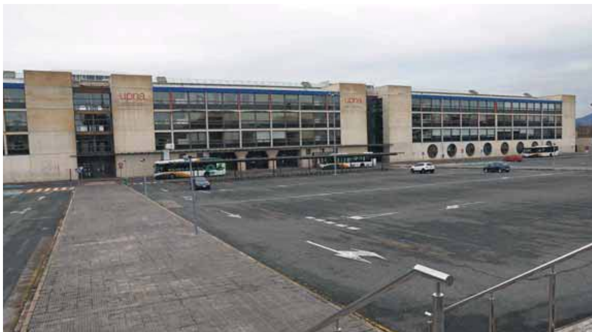
El aparcamiento del Aulario de la UPNA, vacío tras decretarse el Estado de Alarma. La Universidad retoma algunos servicios presenciales. BUXENS