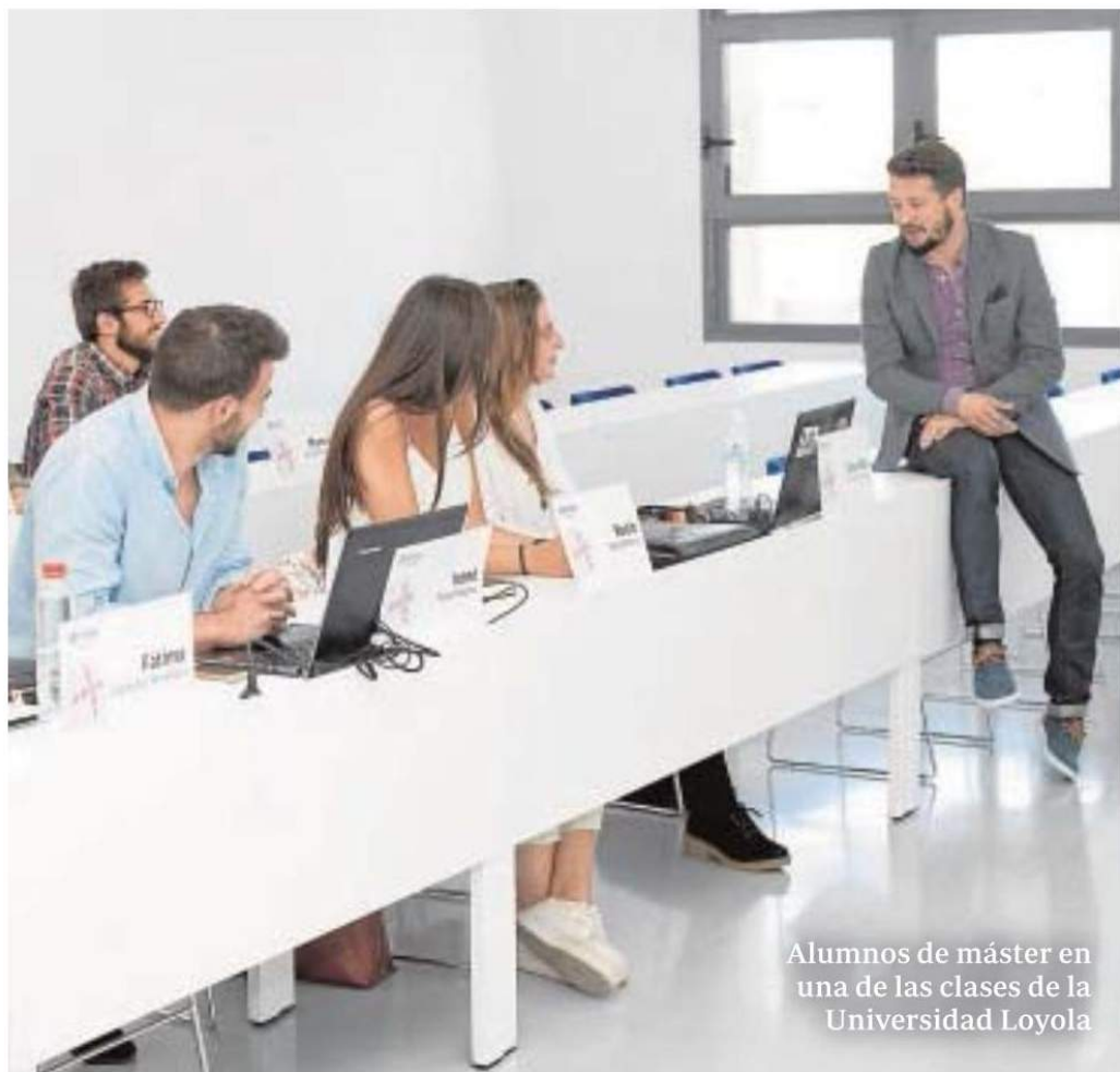
Alumnos de máster en una de las clases de la Universidad Loyola