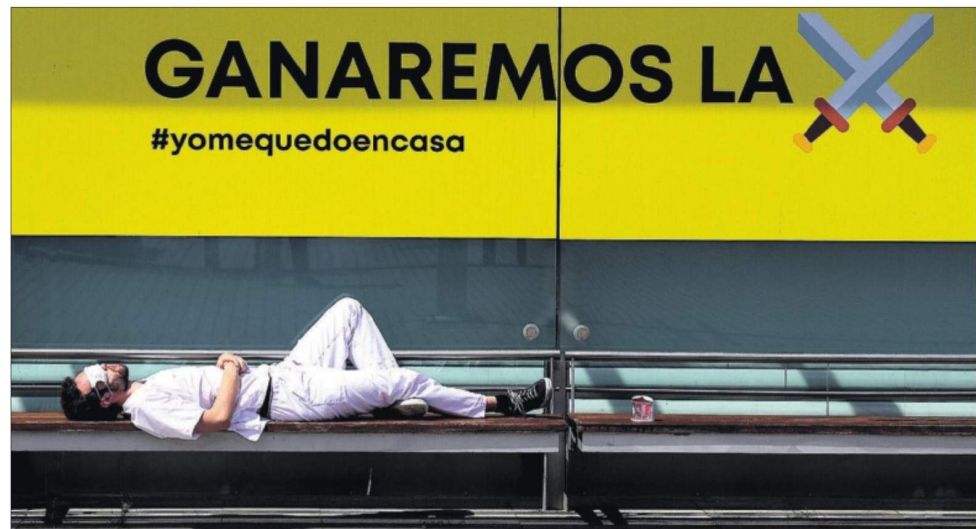
DESCANSO EN IFEMA, DONDE LO PEOR HA PASADO. Un enfermero que trabaja en el hospital de campaña montado en el recinto ferial de Ifema, en Madrid, descansa ayer. Quedan ya pocos enfermos. El hospital se clausurará el viernes. / JAIME VILLANUEVA MADRID

MACARENA VIDAL LIY, Pekín Las autoridades chinas han puesto fecha a la gran cita política anual del Partido Comunista, que estaba prevista para marzo y tuvo que ser postergada por la pandemia. La Asamblea Nacional Popular está prevista ahora para el 22 de mayo y su convocatoria representa el símbolo político de que la crisis sanitaria está bajo control. PÁGINA 4