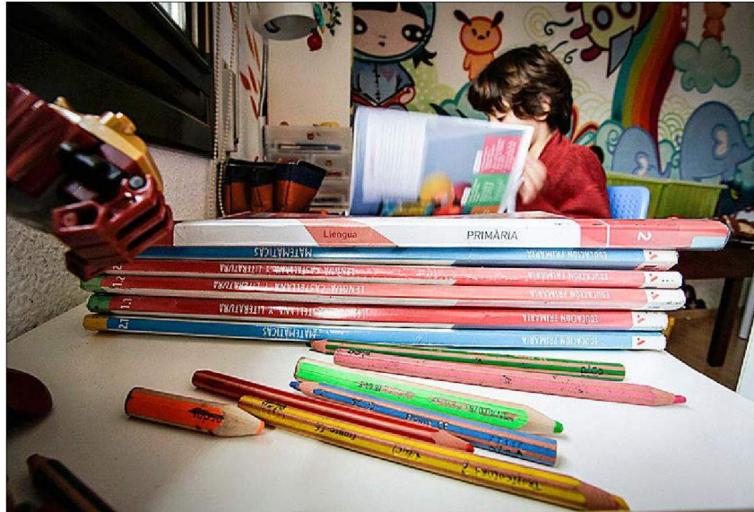
Un alumno de Primaria de Valencia estudia en su casa a distancia.

La orden contempla que sean los gobiernos regionales los que decidan por su cuenta los criterios de promoción y titulación (es decir, con cuántos suspensos se pasa de curso o se obtiene el título de la ESO y Bachillerato) y también los que fijen qué contenidos son los que preferentemente deben ser impartidos. «Las administraciones educativas, los centros y el profesorado organizarán planes de recuperación y adaptación del currículo y de las actividades educativas para el próximo curso, con objeto de permitir el avance de todo el alumnado y especialmente de los más rezagados», señala la orden.