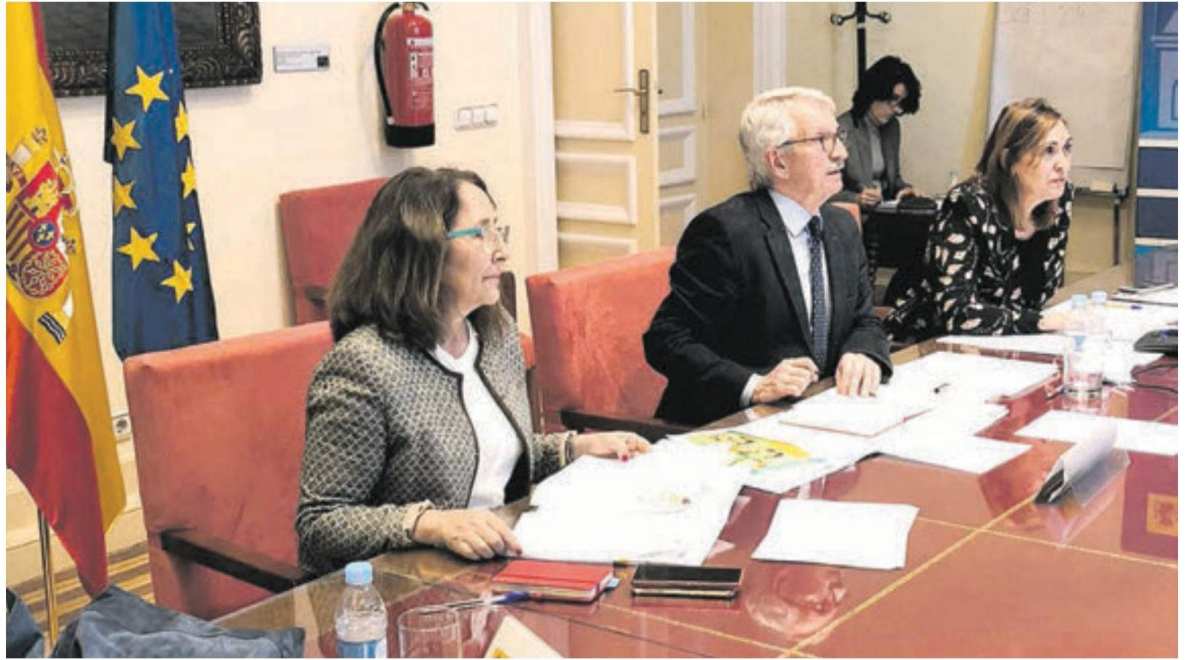
Reunión telemática de los representantes del Ministerio con las comunidades y la universidades. MEFP

El Ministerio, en una reunión celebrada la semana pasada presentó a los sindicatos una propuesta de modificación del RD 84/2018 que modificó el RD 276/2007 de ingreso y acceso a los cuerpos docentes para que la vigencia del mismo se extienda a las OEP aprobadas o que se vayan a aprobar en el año 2020 vinculadas a las plazas de estabilización. El MEFP ha hablado con las comunidades y se mantiene la convocatoria de oposiciones previstas. También se ha elaborado material multimedia.