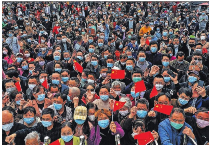
WUHAN, LUZ AL FINAL DEL TÚNEL. Las autoridades chinas anunciaron que el 8 de abril se levantará la cuarentena impuesta desde hace dos meses a Wuhan, la ciudad que durante semanas fue epicentro de la epidemia. El resto de la provincia de Hubei, de 56 millones de habitantes, recuperará hoy la movilidad. En la foto, vecinos de Chongqing despiden al equipo médico que ha dado por terminado su trabajo. PÁGINA 29

La India ordena el confinamiento de 1.300 millones de personas P28