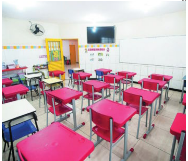
Más de 25.000 profesores están utilizando la plataforma EducaMadrid y al menos 23.000 usan las aulas virtuales en la Comunidad de Madrid

Sobre las oposiciones a docente de Enseñanza Secundaria y Especialidades, previstas para el 20 de junio para cubrir 2.900 plazas, la Consejería estaría dispuesta a mantener la convocatoria, aunque también valora posponerlas al año que viene y hacerlas coincidir con las de Primaria.