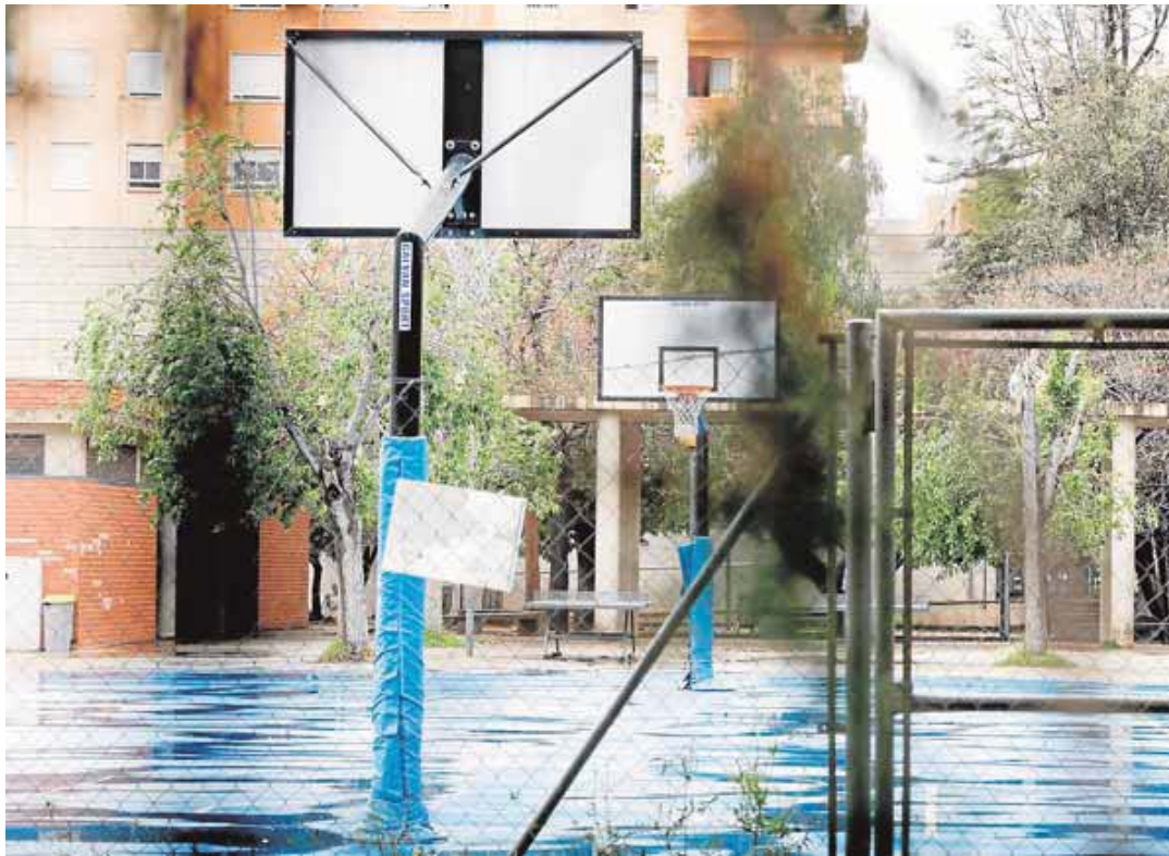
Un colegio de Valencia completamente cerrado el pasado lunes.