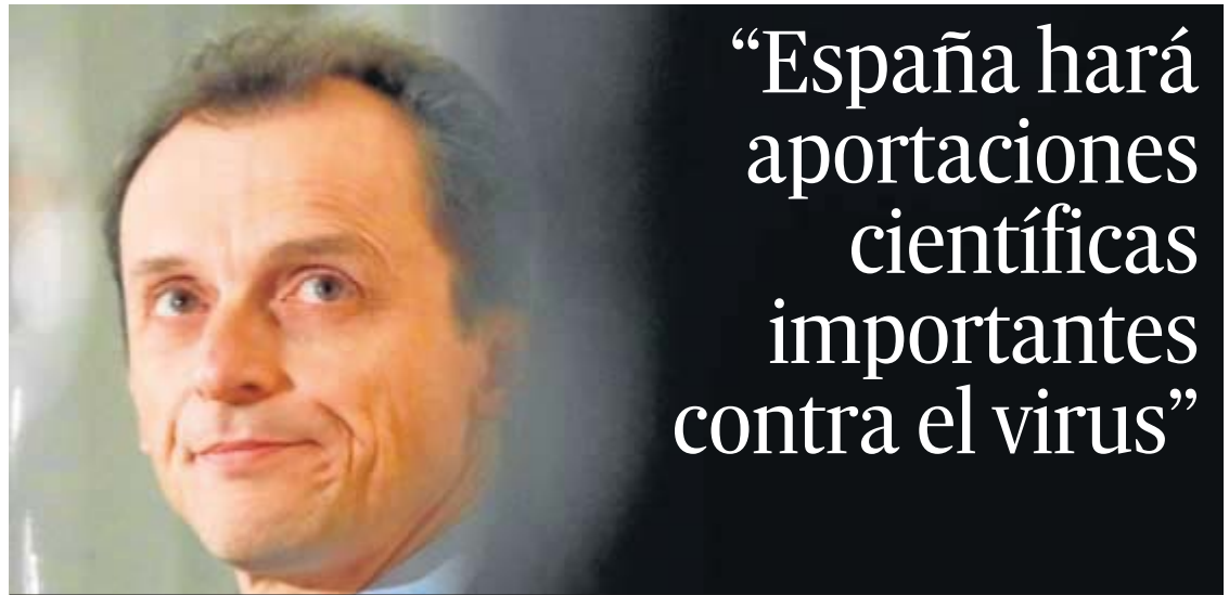
El ministro de Ciencias e Innovación, Pedro Duque, en una imagen reciente.

● "La ciencia va a dar con las soluciones", dice el ministro, convencido de que los países no están en "una carrera", sino colaborando entre sí