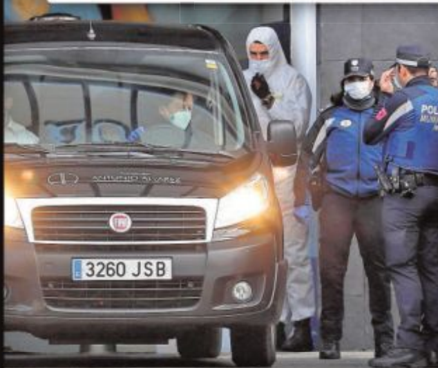
El Palacio de Hielo de Madrid, convertido en morgue, recibe los primeros coches fúnebres mientras en los hospitales se vacían las estanterías, los sanitarios usan viseras caseras y siguen faltando mascarillas quirúrgicas

[Astrolabio, Editorial, Tercera, Enfoque y páginas 16-18 y 34-35]