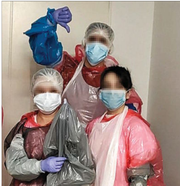
CHUBASQUEROS, BOLSAS DE BASURA Y ESPARADRAPOS Bolsas de basura 'confeccionadas' como batas con esparadrapo y chubasqueros es la protección que usa el personal sanitario en el hospital de Getafe, en Madrid. VIRGINIA GÓMEZ. E.M. PÁG. 5

los sanitarios infectados. Se trata de una situación que en la Comunidad de Madrid se califica de «desesperada». PÁGINAS 4 Y 5