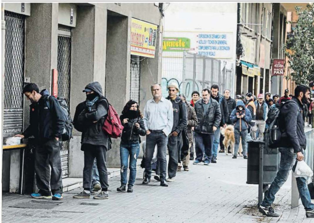
LARGAS COLAS PARA RECOGER COMIDA