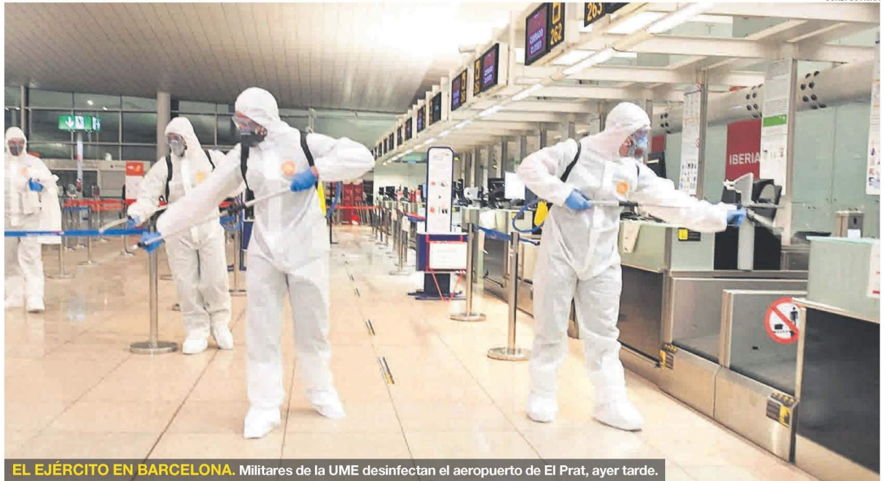
EL EJÉRCITO EN BARCELONA. Militares de la UME desinfectan el aeropuerto de El Prat, ayer tarde.