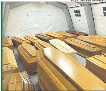
Ataúdes dispuestos en Bérgamo (Italia).