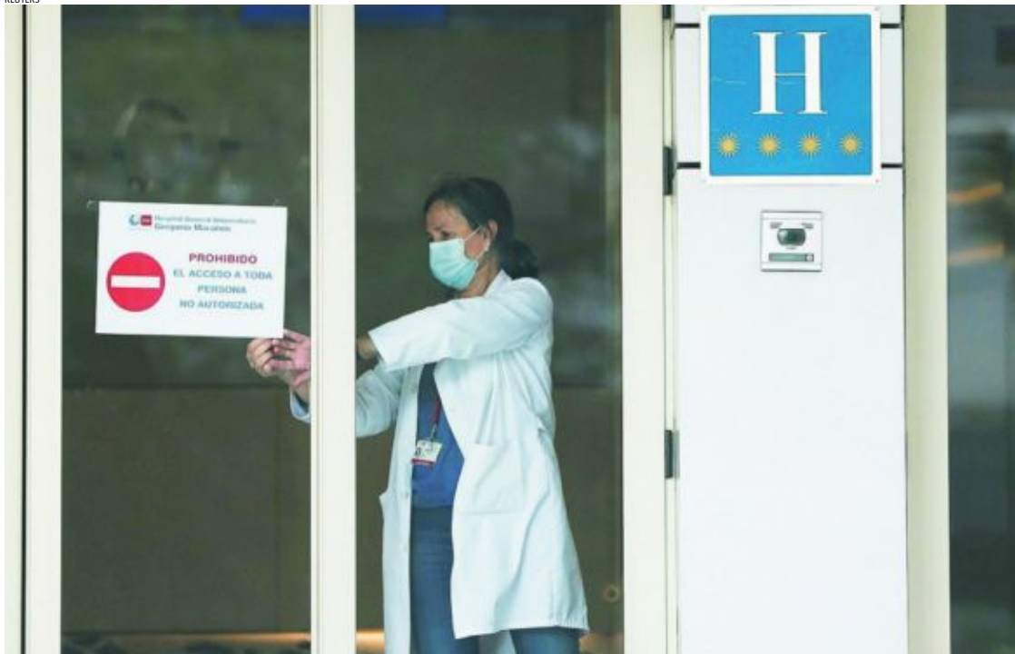
Acceso al Ayre Gran Hotel Colón de Madrid, convertido desde ayer en un hospital para pacientes leves infectados por coronavirus