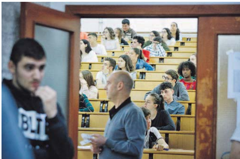
Unos 12.000 alumnos gallegos se presentan cada curso a las pruebas de selectividad.

Pues bien, la realidad gallega desmiente esta idea. Según los datos a los que ha tenido acceso La Voz —no son oficiales, pero sí contrastados y publicados anteriormente—, la diferencia media entre las notas del bachillerato y la selectividad es prácticamente igual entre la escuela pública y la privada. De hecho, si uno quisiera buscar un ganador serían precisamente los centros de pago, aunque por la mínima: la diferencia media entre nota que les ponen en bachillerato y la obtenida luego en selectividad en 189 institutos públicos analizados es de 1,43 puntos; en los 49 colegios privados estudiados es de 1,42. En ambos casos durante seis cursos: de la selectividad de junio del 2013 a la del 2017 y en la última, la de junio del 2019. La diferencia por tanto es prácticamente la misma.