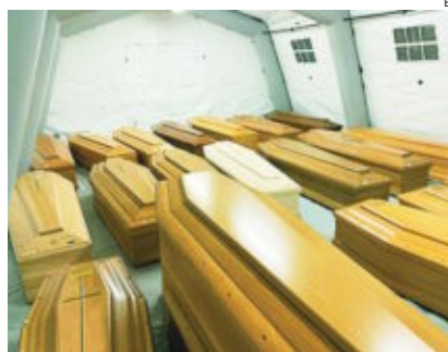
Ataúdes apilados en el exterior del cementerio de Bérgamo

do. Italia alcanza las 3.405 víctimas cuando no ha pasado un mes desde que aparecieron los primeros contagios locales, con una población 23 veces inferior a la china.