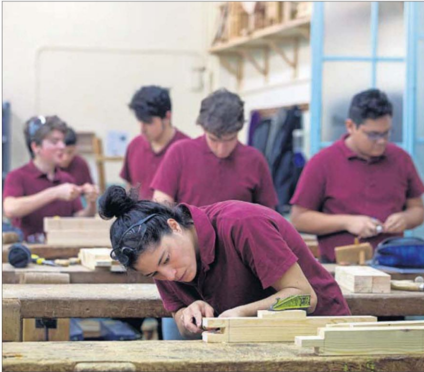
Estudiantes de Formación Profesional, en un taller de carpintería de Barcelona.