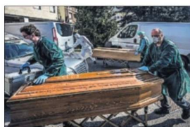
Traslado de ataúdes en Bérgamo.

L. PACHO / M. VIDAL LIY Roma / Pekín Bérgamo, donde una procesión de camiones blindados sacaba de la ciudad 70 ataúdes que se acumulaban en cementerios desbordados, se ha convertido en el símbolo de la tragedia de Italia, el país que ya es el que registra más muertos del mundo, con