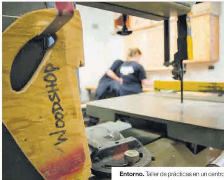
Entorno. Taller de prácticas en un centro.