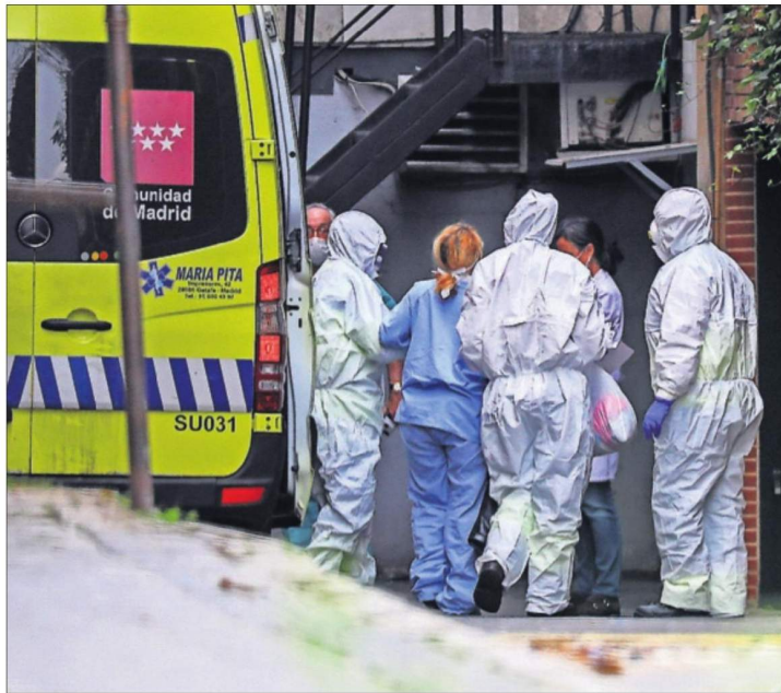
DE GRAN HOTEL A HOSPITAL. El Gran Hotel Colón de Madrid es uno de los que se han acondicionado como hospitales provisionales para los casos menos graves de la Covid-19. En la imagen, una mujer era ingresada ayer en el establecimiento, al que fue trasladada en ambulancia.

Los españoles cumplen con las normas establecidas durante el estado de emergencia: así lo afirman siete de cada diez. En todo caso, el 60% vive el confinamiento poco o nada nervioso, aunque un 30% dice estar bastante nervioso y un 11%, mucho. Son mayoría los que se han sumado al aplauso solidario cada noche desde sus ventanas o balcones, y un 30% se ha ofrecido a ayudar a otras personas. PÁGINAS 12 Y 13